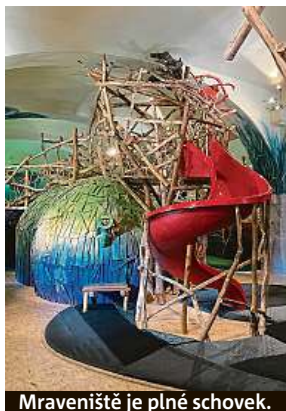
Mraveniště je plné schovek.

Ve druhé části uzavřeného areálu se děti vyblbnou v bludišti, ale i u plechové kozy, na které si mohou zkusit, jak se dojí doopravdy. Milovníci vláček si pouští modely starých lokomotiv. Tvůrčí dílna nabízí za pár korun sádrové odlitky, které děti nadšeně zdobily barvami a různými třpytkami. Obdivovat můžete živé oslíky a suchozemskou želvu. Za správné odpovědi si děti navíc od víly odnesly domů knížky. Rodiče ocení občerstvení u Čertova mlýna, kde mají výbornou kávu, zákusky, šunku od kosti, ale i pizzu z kamenné pece. Vstupné činí 85 korun. Děti do dvou let můžou jít zdarma. Více informací najdete na pohadkovakovarna.cz .