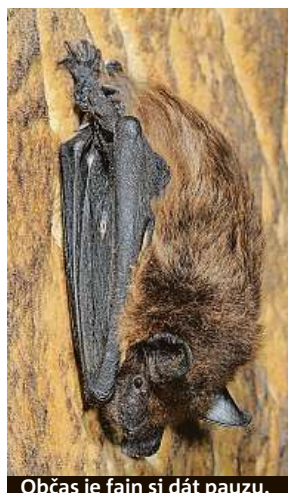
Občas je fajn si dát pauzu.