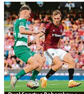
Duel Sparty s Bohemkou