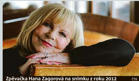
Zpěvačka Hana Zagorová na snímku z roku 2012