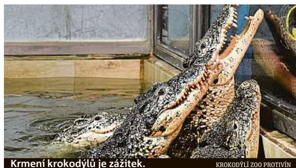
Krmení krokodýlů je zážitek.

Na komentované krmení krokodýlů se můžete vypravit každou středu, sobotu a neděli, vždy od 11 a 14 hodin v Krokodýlí zoo Protivín. Nabízí také focení s krokodýly v rámci zážitkového programu Zažij evoluci za sto korun. Chovají celkem 23 druhů krokodýlů. Více informací najdete na krokodylizoo.cz .