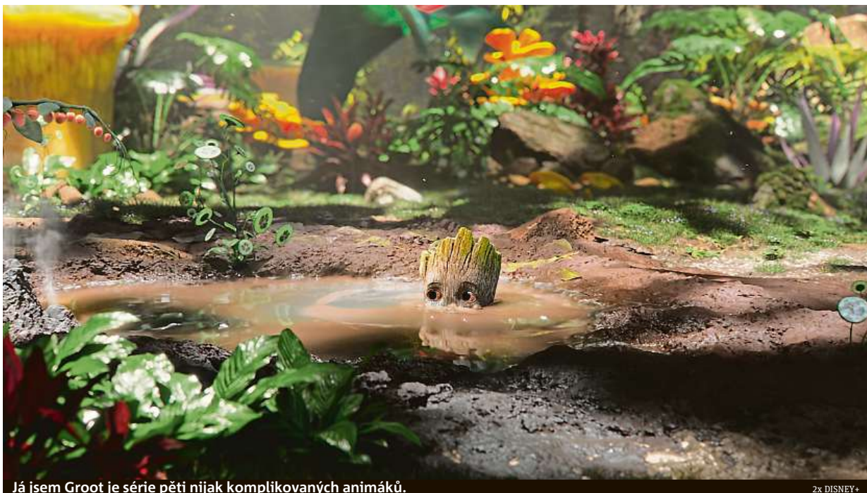
Já jsem Groot je série pěti nijak komplikovaných animáků.

Krátkometrážní příběhy stromového komiksového hr-