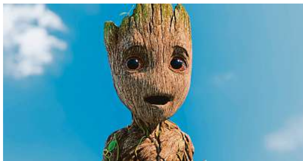
Krátkometrážní příběhy táhnou. Tak proč ne s Grootem.