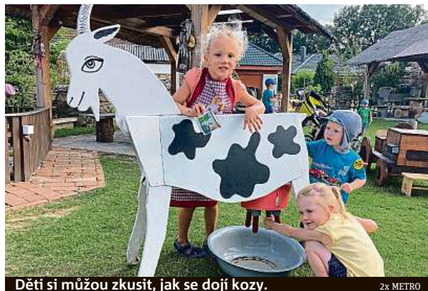
Děti si můžou zkusit, jak se dojí kozy.