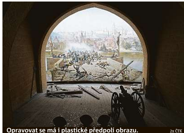
Opravovat se má i plastické předpolí obrazu.

Myslím, že ne, ale úspěch a vysoká návštěvnost pavilonu s obrazem byly velkým ar-