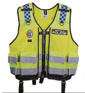
Nová vesta strážníků MPP

Emoce vesty probudily i v Pražanech, kteří jsou podle svých slov také strážníci. Někteří z nich tvrdí, že kvůli vestám od městské policie v metropoli klidně odejdou. Kromě vzhledu a funkčnosti nového oblečku se totiž snaší kritika i na umělý materiál,