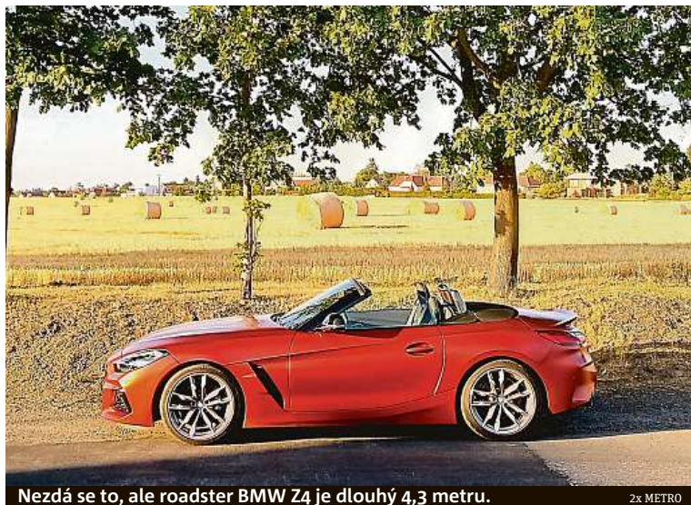
Nezdá se to, ale roadster BMW Z4 je dlouhý 4,3 metru.