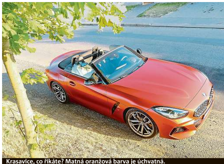
Krasavice, co říkáte? Matná oranžová barva je úchvatná.