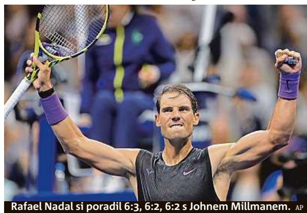
Rafael Nadal si poradil 6:3, 6:2, 6:2 s Johnem Millmanem.