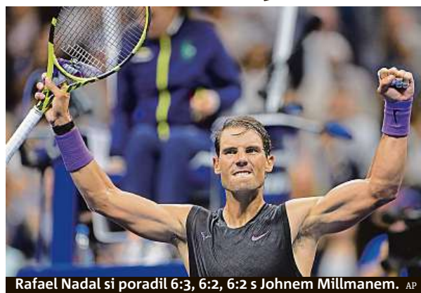
Rafael Nadal si poradil 6:3, 6:2, 6:2 s Johnem Millmanem.

Tenistka Kristýna Plíšková prošla na grandslamovém US Open do 2. kola po výhře nad Francouzskou Diane Parryovou 6:4 a 6:3. Se soutěží se naopak rozloučily letošní semifinalistka Wimbledonu Barbora Strýčková, Marie Bouzková a Kateřina Siniaková. Čtvrtý tenista světového žebříčku Dominic Thiem z Rakouska v 1. kole podlehl 4:6, 6:3, 3:6 a 2:6 Thomasi Fabbianovi z Itálie. Stejně dopadla také domácí vítězka posledního grandslamu sezony z roku 2017 Sloane Stephensová. ČTK