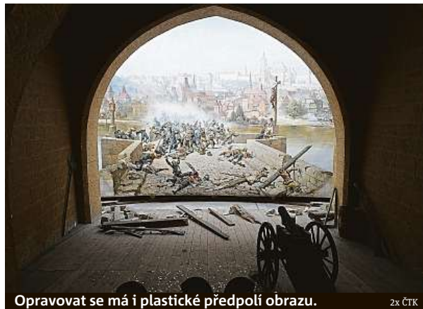
Opravovat se má i plastické předpolí obrazu.

Myslím, že ne, ale úspěch a vysoká návštěvnost pavilonu s obrazem byly velkým ar-