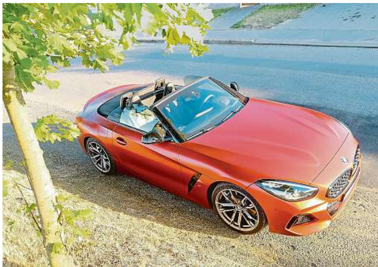
Krasavice, co říkáte? Matná oranžová barva je úchvatná.