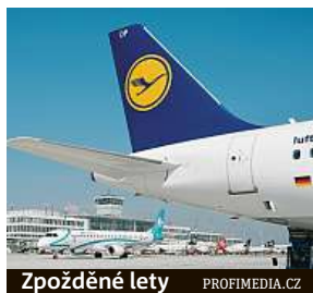
Zpožděné lety

z Thajska a při přestupu na let do Madridu neprošel vstupní kontrolou. Místo