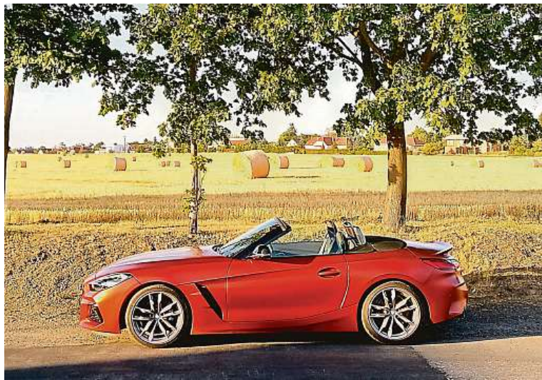
Nezdá se to, ale roadster BMW Z4 je dlouhý 4,3 metru.