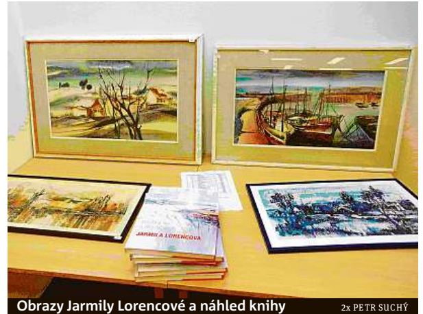
Obrazy Jarmily Lorencové a náhled knihy

Nápad věnovat jí knihu jsem nosil v hlavě roky, ale nechtěl jsem se do ní pouštět, dokud umělkyně stále tvořila.