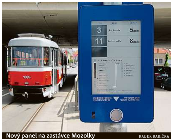
Nový panel na zastávce Mozolky

Že by v brzké době došlo k výraznému rozšíření označníků, se ale nezdá. Dopravní podnik aktuálně využívá elektronické informační panely. Jejich instalace začala v roce 2014 a nyní jsou cestujícím k dispozici na 50 zastávkách. Do konce roku jimi DPMB plánuje osadit dalších pětacet zastávek. BAB