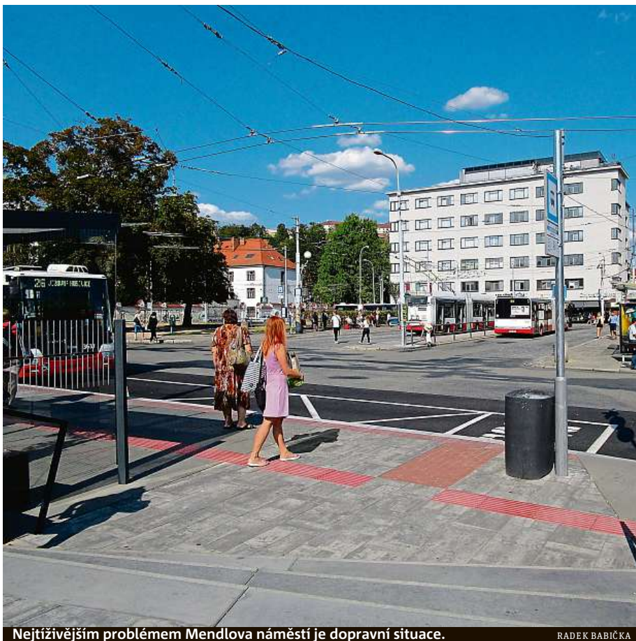
Nejtíživějším problémem Mendlova náměstí je dopravní situace.