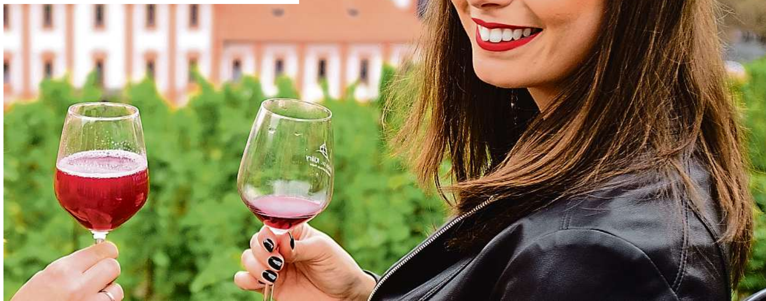
Na Trojském vinobraní panovala v loňském roce dobrá nálada.