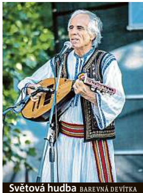
Světová hudba BAREVNÁ DEVÍTKA

Park Podviní se v sobotu od 12 hodin opět rozvoní cizokrajným jídlem.