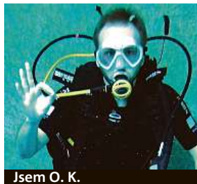
Jsem O. K.