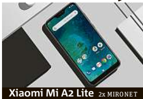
Xiaomi Mi A2 Lite 2x MIRONET

Mnozí uživatelé proto dnes smartphony nevybírají jen podle samotných vlastností zařízení, ale také na základě množství kompatibilního příslušenství. Pokud například trávíte celé dny na cestách bez možnosti nabití telefonu,