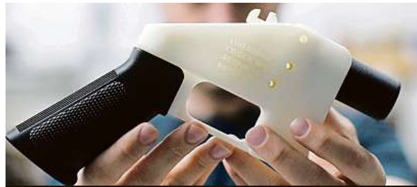
Zbraň vytištěná na 3D tiskárně

Zbraně z 3D tiskáren sice dlouho nevydrží, ale nebezpečné být mohou.