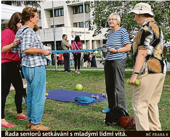
Rada seniorů setkávání s mladými lidmi vítá.