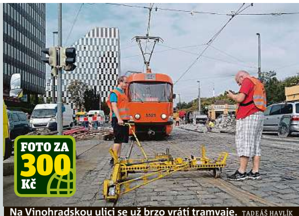
Na Vinohradskou ulici se už brzo vrátí tramvaje. TADEÁŠ HAVLÍK

Od této soboty budou znovu jezdit tramvaje po Vinohradské ulici v úseku Želivského–Flora, Flora–Muzeum a Škréťovou ulici v úseku Muzeum–I. P. Pavlova, ale také po Zenklově ulici v úseku Palmovka–Ke Stírce. Probíhaly zde rozsáhlé rekonstrukce tramvajové trati. Příští rok se bude opravovat úsek Flora–Muzeum.