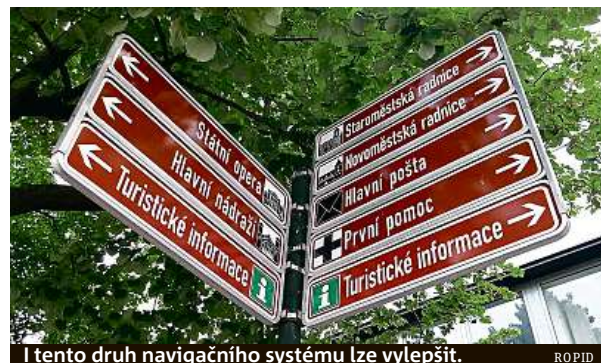
I tento druh navigačního systému lze vylepšit. ROPID

Nejčastěji zaznávají různé nápady, které by lidem usnadnily navigaci při výstupu z metra a přestupu na povrchovou dopravu. Lidem chybí čísla navazujících spojů tramvají a autobusů. Tomáš napsal: „Udělat přehlednější informační cedule při výstupu z metra. Například přidat