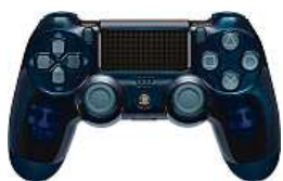
Ovladač DualShock MIRONET

První generace herní konzole se zrodila v roce 1997, dnes je na trhu generace čtvrtá.