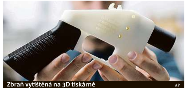
Zbraň vytištěná na 3D tiskárně

Zbraně z 3D tiskáren sice dlouho nevydrží, ale nebezpečné být mohou.