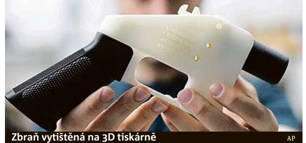
Zbraň vytištěná na 3D tiskárně

Zbraně z 3D tiskáren sice dlouho nevydrží, ale nebezpečné být mohou.