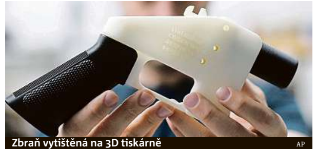
Zbraň vytištěná na 3D tiskárně

Zbraně z 3D tiskáren sice dlouho nevydrží, ale nebezpečné být mohou.