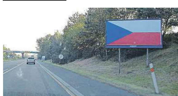
Dálnice D10 je plná vlajek. Není jediná.

Podle Ústředního automotoklubu je česká vlajka trik.