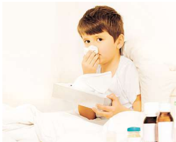
Dbejte na posílení imunity svých dětí.

Podle odborníků se až 70 procent imunity nachází ve střevě. Je tedy logické, že