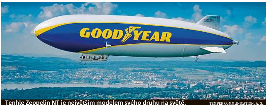
Tenhle Zeppelin NT je největším modelem svého druhu na světě.

Nad starým kontinentem je v těchto dnech vidět vzducholod'. Mimo jiné proletěla nad legendárním závodním okruhem v německém Nürburgringu, kde nasnímala letecké záběry závodů Světového poháru cestovních vozů FIA World Touring Car Cup (WTCR). Impozantní vzducholod' navštívila různá evropská města a události kalendáře motoristických závodů. Na vlastní oči ji však bylo možné vidět také během jejich přeletů do tak atraktivních evropských měst jako Londýn, Milán, Le Mans. Nyní z polské Wroclavi míří nad Prahu a také nad Plzeň a Trutnov.