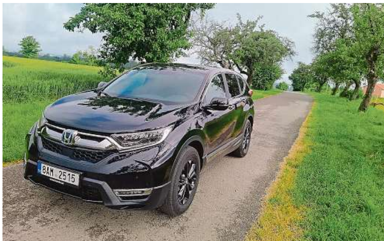
Honda CR-V stále působí robustním dojmem, v černé jí to sluší.