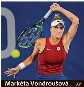
Markéta Vondroušová

České tenistky můžou na olympijských hrách získat dva cenné kovy. Do semifinále singlu prošla Markéta Vondroušová a poté uspěly i deblistky Barbora Krejčíková s Kateřinou Siniakovou. Vondroušová postoupila poté, co ve čtvrtfinále vyhrála nad Paulou Badosovou první set 6:3, načež vyčerpaná Španělka zápas vzdala. První nasazený pár Krejčíková, Siniaková otočil duel s Australankami Ashleigh Bartyovou a Storm Sandersovou a vyhrál 3:6, 6:4 a 10:7 v super tie-breaku.