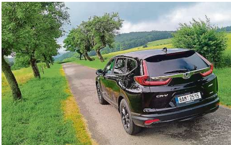
Průměrná spotřeba hybridu byla během testu na hodnotě 7,2 litru na sto.