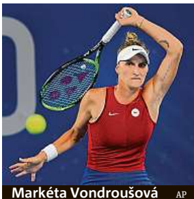
Markéta Vondroušová

České tenistky můžou na olympijských hrách získat dva cenné kovy. Do semifinále singlu prošla Markéta Vondroušová a poté uspěly i deblistky Barbora Krejčíková s Kateřinou Siniakovou. Vondroušová postoupila poté, co ve čtvrtfinále vyhrála nad Paulou Badosovou první set 6:3, načež vyčerpaná Španělka zápas vzdala. První nasazený pár Krejčíková, Siniaková otočil duel s Australankami Ashleigh Bartyovou a Storm Sandersovou a vyhrál 3:6, 6:4 a 10:7 v super tie-breaku.