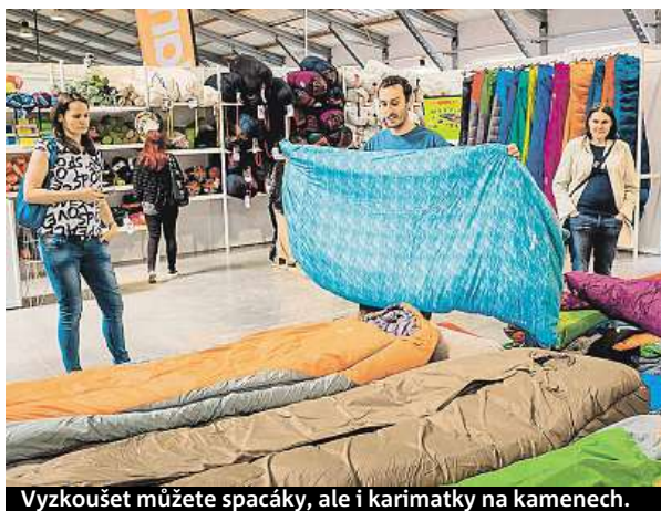
Vyzkoušet můžete spacáky, ale i karimatky na kamenech. METRO

stan i za pár stovek. „Naopak expediční ultralehký stan pro dva lidi může stát okolo 20 tisíc i více. Ještě větší cenový rozsah můžete čekat u rodinných stanů. Stan pro čtyři osoby vás bude stát nejčastěji okolo 4 až 7 tisíc, ty nejluxusnější i hodně přes 40 tisíc,“ podotýká Skalka.