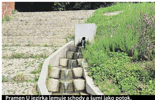
Pramen U jezírka lemuje schody a šumí jako potok.