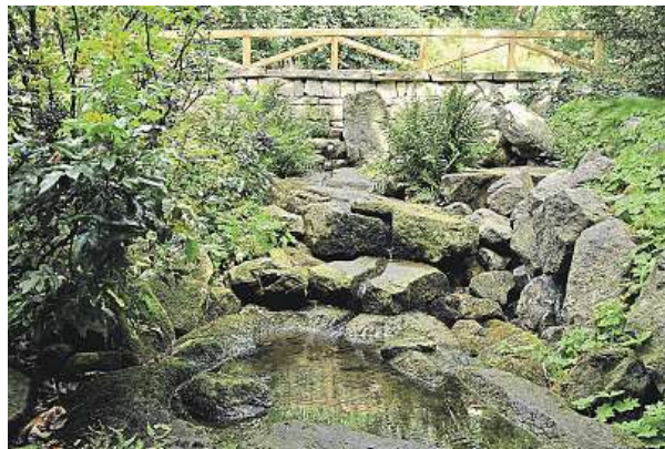
Pramen přitékající do jezírka Lachtan

Hlavní tř. 50/34, 353 01 Mariánské Lázně tel.: 354 622 451, 603 538 767 e-mail: recepcie@hotelpolonia.cz www.hotelpolonia.cz