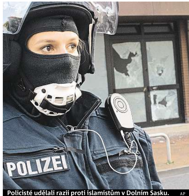
Policisté udělali razii proti islamistům v Dolním Sasku.

„DIK v Hildesheimu je celoněmecké ústředí radikální salafistické scény. Po měsících příprav jsme touto razíí udělali důležitý krok k zakázání tohoto spolku,“ řekl dolnosaský zemský ministr vnitra Boris Pistorius. ČTK, MET