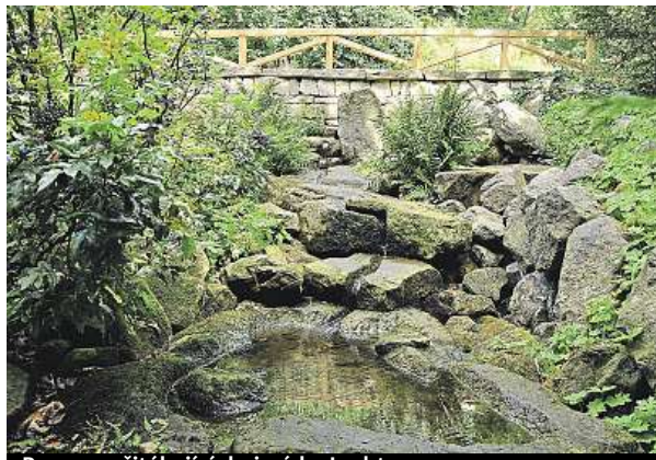
Pramen přitékající do jezírka Lachtan

Hlavní tř. 50/34, 353 01 Mariánské Lázně tel.: 354 622 451, 603 538 767 e-mail: recepcie@hotelpolonia.cz www.hotelpolonia.cz