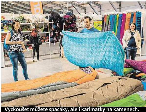
Vyzkoušet můžete spacáky, ale i karimatky na kamenech.

stan i za pár stovek. „Naopak expediční ultralehký stan pro dva lidi může stát okolo 20 tisíc i více. Ještě větší cenový rozsah můžete čekat u rodinných stanů. Stan pro čtyři osoby vás bude stát nejčastěji okolo 4 až 7 tisíc, ty nejluxusnější i hodně přes 40 tisíc,“ podotýká Skalka.