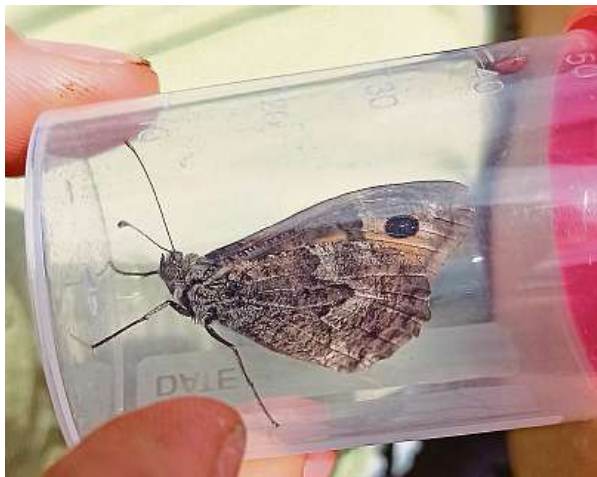
Tuhle fotografii okáče metlicového zveřejnila na inaturalist.org uživatelka s přezdívkou martamumin.

Čím více pozorování se podaří dobrovolníkům zaznamenat a fotografie sdílet přes aplikaci iNaturalist či facebookovou stránku akce, tím lépe. V letošním roce je podle