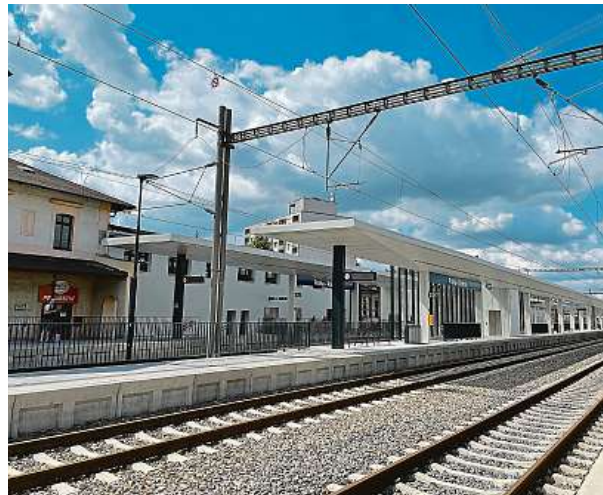
Modernizace nádražní budovy v Radotíně by měla být dokončena v závěru letošního roku.

Celkové investiční náklady na optimalizaci trati mezi Smíchovem a Černošicemi