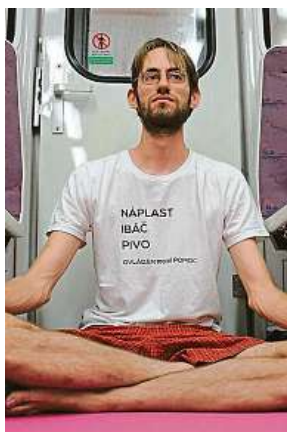
Podle joginů není třeba sedat si na zem.

„Nádech, s výdechem natočte bradu nad pravou klíční kost, nádech, s výdechem přesuňte ruce za pravé stehno a celý trup i s hlavou natočte doprava, nádech, s výdechem se malinko předkloníte, jako byste se dívali za pravé chodidlo, zda tam něco není. Nádech, s výdechem pomalu zpět, protažení od beder po šíji můžete dělat po-