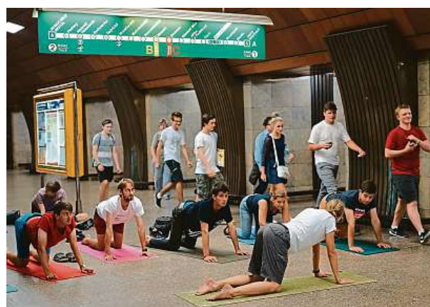
V září 2016 se recesistická partička procvičila za plného provozu pražského metra. Foto ze stanice linka A Želivského.

Podle ní je velice zdravé dýchat po jogínsku do břicha, tedy když s výdechem říkáte