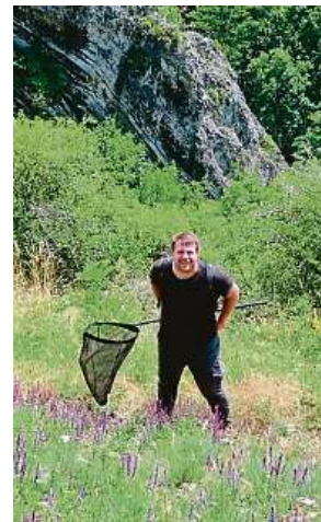
Odchyt v nejatraktivnějších částech Prokopáku