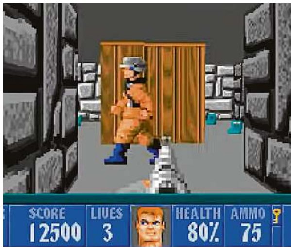
Hru si můžete zapařit třeba na webu retrogames.cz. ID SOFTWARE