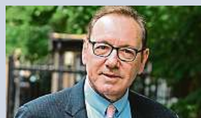
Kevin Spacey u soudu

ních trestných činů proti čtyřem mužům. Herec, který získal Oscara za role ve filmech Americká kráska a Obvyklí podezřelí, kvůli skandálu přišel i o hlavní roli v seriálu Dům z karet.