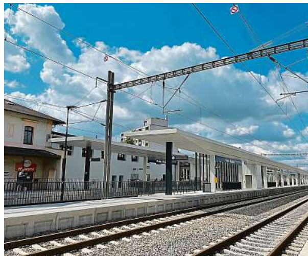
Modernizace nádražní budovy v Radotíně by měla být dokončena v závěru letošního roku.

Celkové investiční náklady na optimalizaci trati mezi Smíchovem a Černošicemi