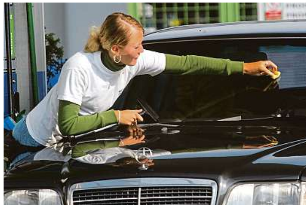
5 brigádníky se v létě setkáváme téměř všude. Způsob výplaty ze strany prázdninového zaměstnavatele může být různý.

Nejčastějšími smlouvami u brigád, bývají dohoda o provedení práce (DPP) a dohoda o pracovní činnosti (DPČ). Obě smlouvy mají jistá omezení. Na DPP je možné odpracovat maximálně 300 hodin v kalendářním roce a na DPČ maximálně polovinu běžné pracovní doby, což bývá ob-