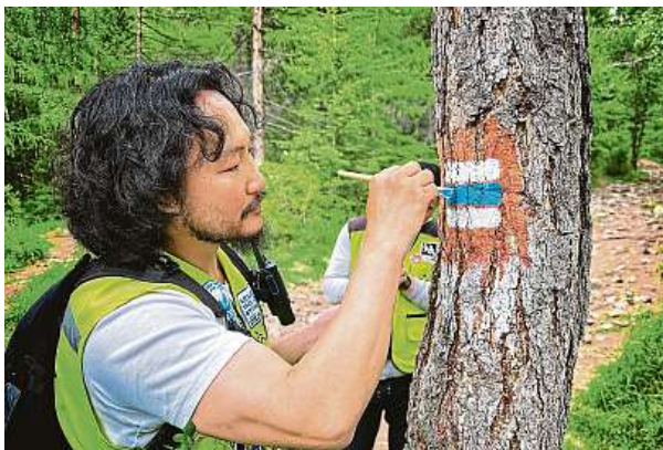
Už značkují. Mongolští turisté nadšenci začali v minulých týdnech označovat trasy ve svých regionech podle českého vzoru. KČT

Tento týden v pondělí bylo v Brně na jednání 14. Vedení KČT slavnostně podepsáno memorandum o spolupráci, které navazuje na již podepsanou smlouvu mezi Klubem českých turistů a Mongolian Walking Association (MWA) o právech na používání turistického značení podle české metodiky. Jejich společným