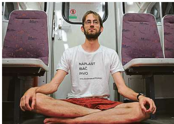
Chcete si v městské hromadné dopravě zacvičit jógu? Sedání na zem ani podložek podle joginů netřeba.