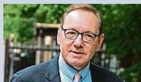
Kevin Spacey u soudu

ních trestných činů proti čtyřem mužům. Herec, který získal Oscara za role ve filmech Americká kráska a Obvyklí podezřelí, kvůli skandálu přišel i o hlavní roli v seriálu Dům z karet.