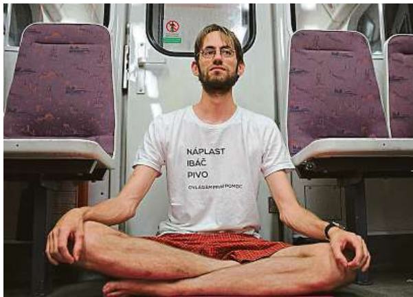
Chcete si v městské hromadné dopravě zacvičit jógu? Sedání na zem ani podložek podle joginů netřeba.