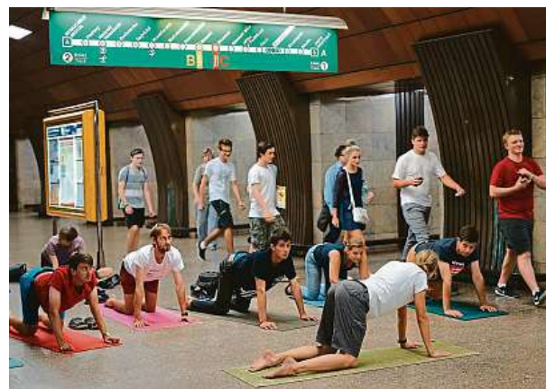
V září 2016 se recesistická partička procvičila za plného provozu pražského metra. Foto ze stanice linka A Želivského.

Dechová cvičení určená pro jízdu hromadnou dopravou měla u čtenářů úspěch. S další alternativou, jak využít čas, přispěla zkušená lektorka jógy.