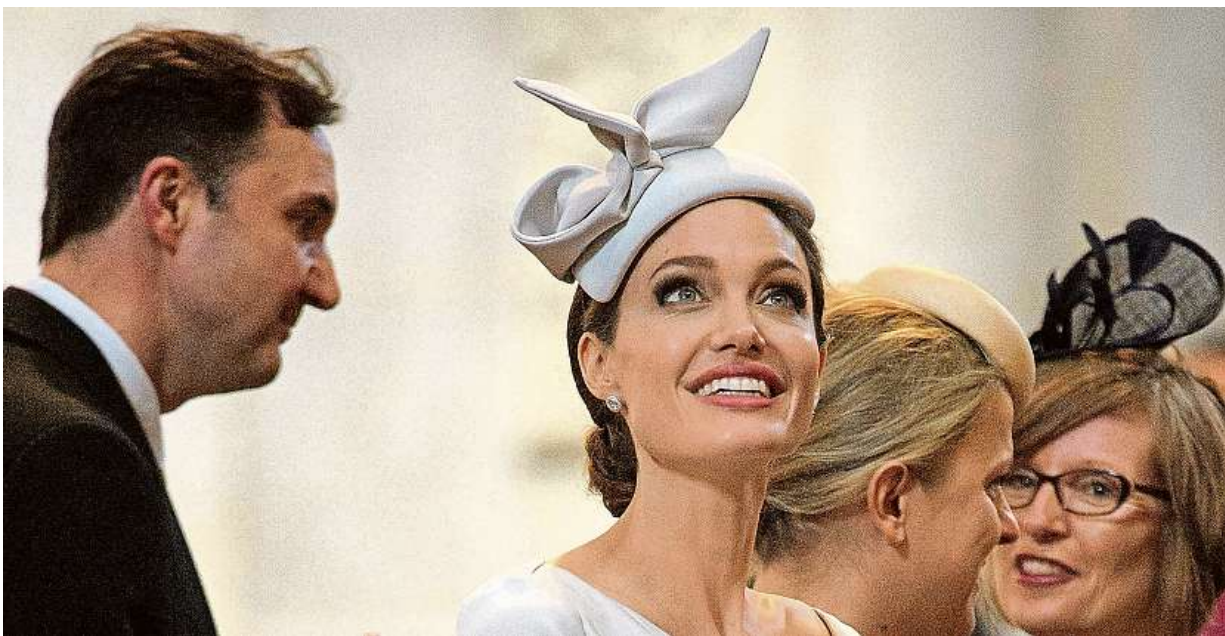
Americká herečka a bojovnice za lidská práva Angelina Jolie navštívila bohoslužbu v londýnské katedrále svatého Pavla.

Léto 2018. Češi vyrážejí na dovolenou, valná většina po vlastní ose k Jadranu. Rady a tipy. Pozor na storno poplatky, půjčené auto i dopravní zácpy a uzavírky. Prázdniny. Jsou i v Německu, Dánsku či Belgii STRANA 8 A 9