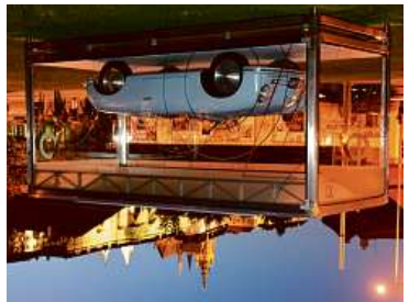
V nepříliš daleké vzdálenosti od centra Prahy na malostranském Klárově.

Musí být možné přepnout míňky. Musí být možné přepnout lea sportovních vozů Porsche zavítal nými do Prahy unikátní automobily, jimž začala nevěšdní historie dnes úspěchy nejen svými sériově vyra- benými vozy, ale také ve světě mo- toristického sportu. Věrná replika prvního prototypu Porsche 356 „č. 1“ Roadster byla vystavena od síte- dy 20. června do neděle 24. června