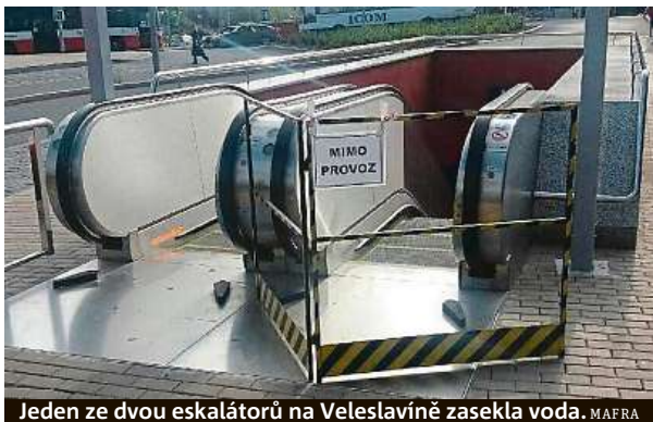
Jeden ze dvou eskalátorů na Veleslavíně zasekla voda.