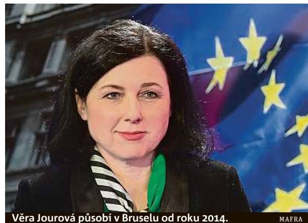
Věra Jourová působí v Bruselu od roku 2014.

Záleží na tom, jestli mě vláda znovu nominuje. Výhodou by bylo, že po pěti letech má už člověk kontakty, vyzná se