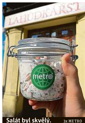
Salát byl skvělý.