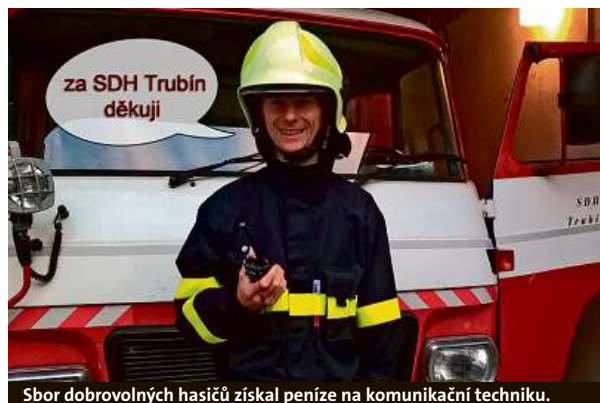
Sbor dobrovolných hasičů získal peníze na komunikační techniku.