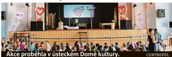
Akce proběhla v ústeckém Domě kultury.

Školáci zvažovali až poté, co byli svědky simulovaného křížení člověka stíženého srdečním záchvatem. Právě srdce a péče o tento životně důležitý orgán byly pojičkem sportovní-vzdělávací akce, kterou uspořádal Nadační fond Energie pomáhá, který založi-