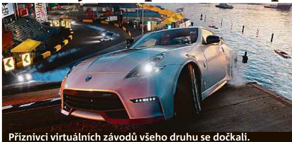
Příznivci virtuálních závodů všeho druhu se dočkali.

Novým hlavním tahákem The Crew 2 je možnost kdykoli přesedlat na jiný druh dopravního prostředku. Změna je opravdu jednoduchá, rychlá a hlavně stylová. Před-