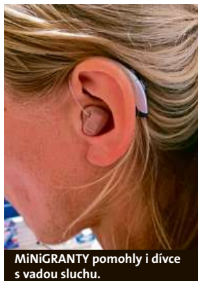
MiNiGRANTY pomohly i dívce s vadou sluchu.