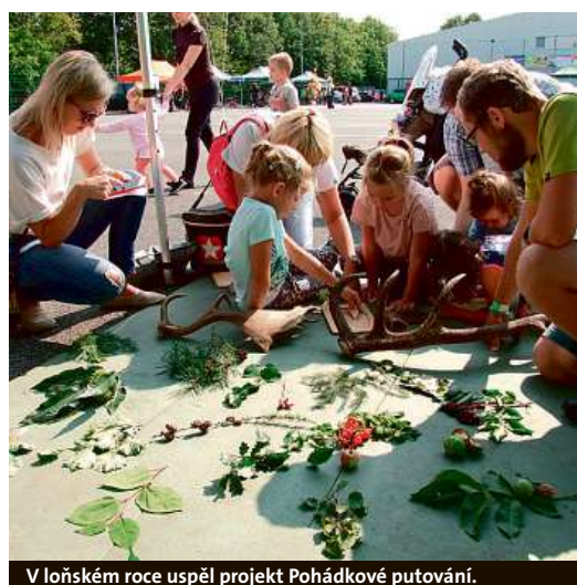
V loňském roce úspěšně proběhl projekt Pohádkové putování.