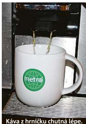
Káva z hrníčku chutná lépe.

„Vlastní nádoby zákazníků by se z hygienických důvodů nemělo nosit do zázemí provozovny a do kuchyně. Takové nádoby se totiž nesmí mí-