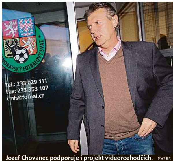
Jozef Chovanec podporuje i projekt videorozhodčích.

Osmapadesátiletý Chovanec patří mezi československé fotbalové legendy. Hrál, trénoval a ve Spartě působil i jako generální sportovní manažer. „Mám zkušenosti z manažerské funkce ve fotbale. A budu mít kolem sebe odborníky, kteří mají dostatek zkušeností s rozhodčími. Budu se snažit rozhodčí rozvíjet podobně, jako jsem rozvíjel hráče,“ řekl Chovanec.