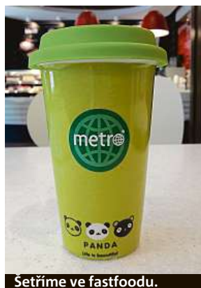
Setříme ve fastfoodu.