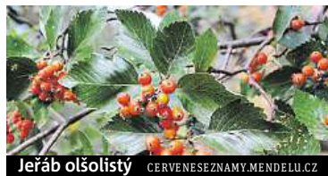
Jeřáb olšolistý CERVENESEZNAMY.MENDELU.CZ