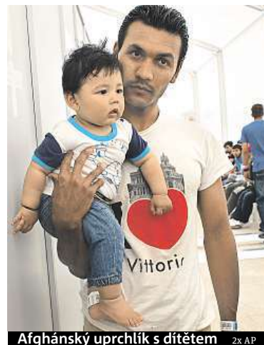
Afghánský uprchlík s dítětem