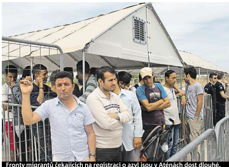
Fronty migrantů čekajících na registraci o azyl jsou v Aténách dost dlouhé.