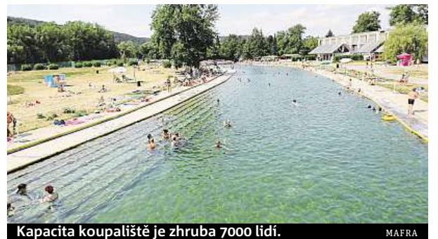
Kapacita koupaliště je zhruba 7000 lidí.

Riviéra je jedním z největších přírodních koupališť v republice a oblíbeným rekreačním areálem. Jeho historie v údolí Svratky sahá až do 19. století, denní kapacita je zhruba 7000 lidí. Kromě koupání nabízí i kurty pro plážový volejbal. ČTK