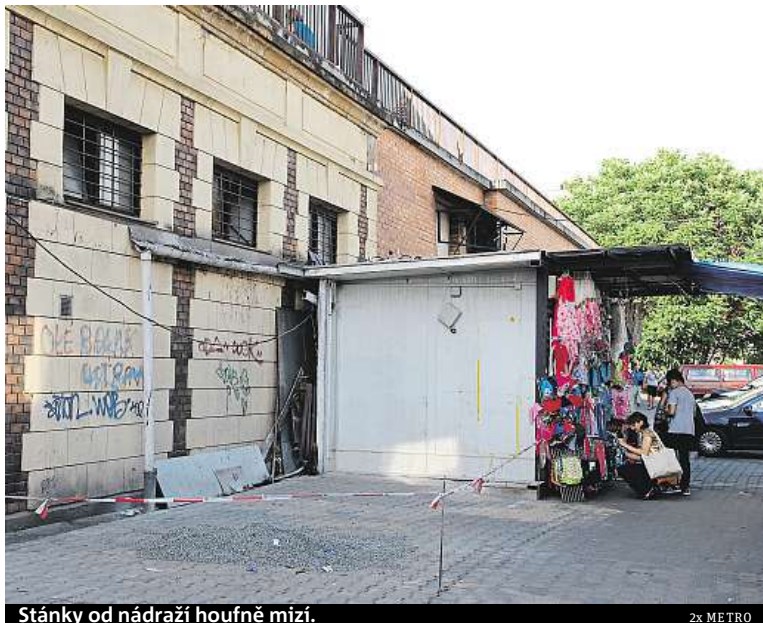
Stánky od nádraží houfně mizí.