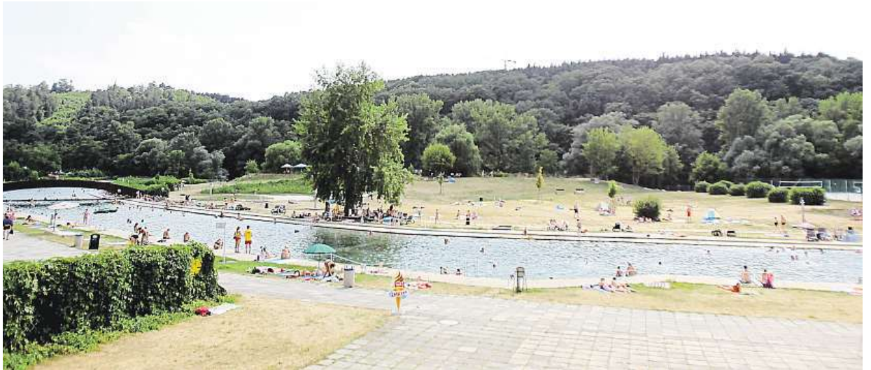
Riviéra je jedno z nejstarších přírodních koupališť v republice, jeho historie sahá až do 19. století.

Starez také musí ještě s městem vyřešit, jak zajistit financování stavby a zda se bude pracovat po etapách, nebo se udělá všechno přísti