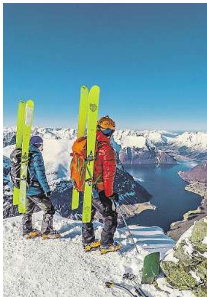
Kluci se výzev nebojí.