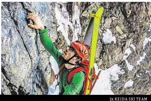
3x KEJDA SKI TEAM

Atlas, kde je několik čtyřtisícových vrcholů. Jedinečné to bylo hlavně tím, že jsme se dostali do kontaktu s místními lidmi. Jeli jsme tam jako vždy na vlastní pěst a třeba