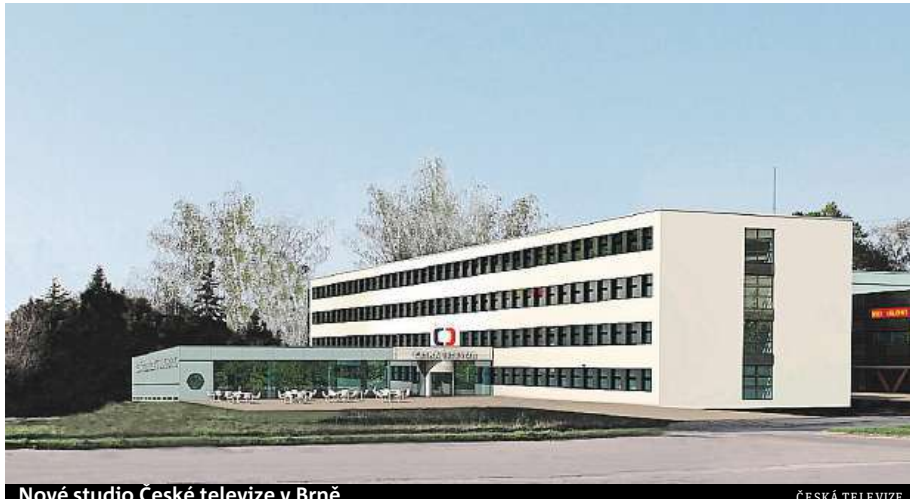
Nové studio České televize v Brně

„Jsme velmi spokojeni, jak si ředitel zatím počínal a dohlížel na stavbu nového stu-