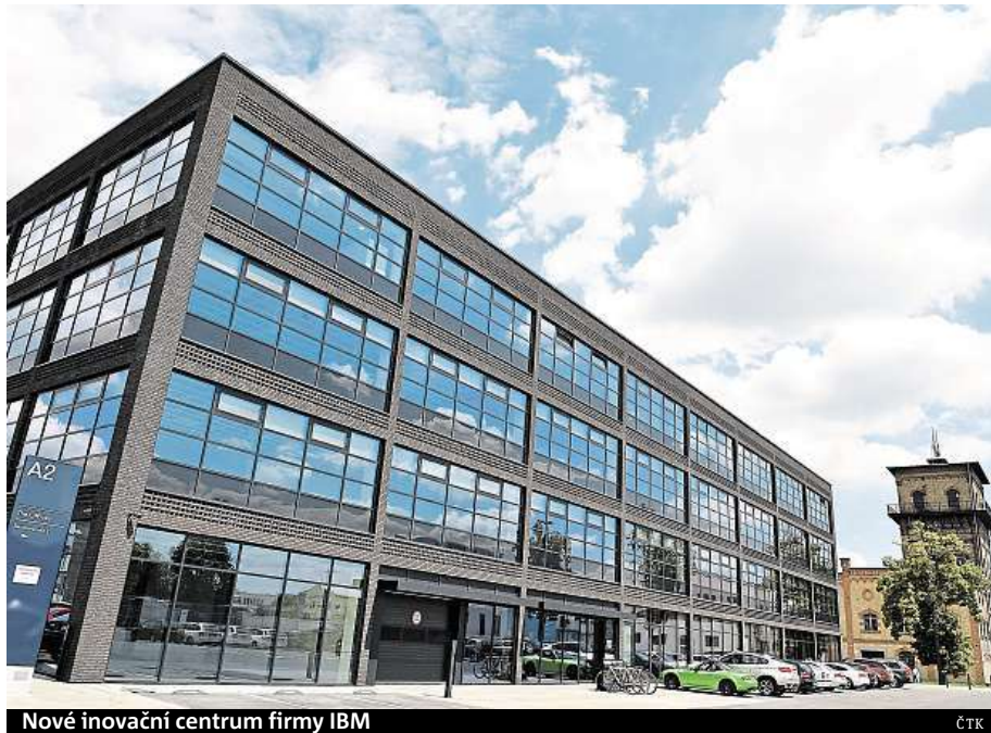
Nové inovační centrum firmy IBM

„Nyní otvíráme druhou lokaci v Brně. To se děje potom, co jsme se značně rozšiřovali a rostli v naší druhé lokaci