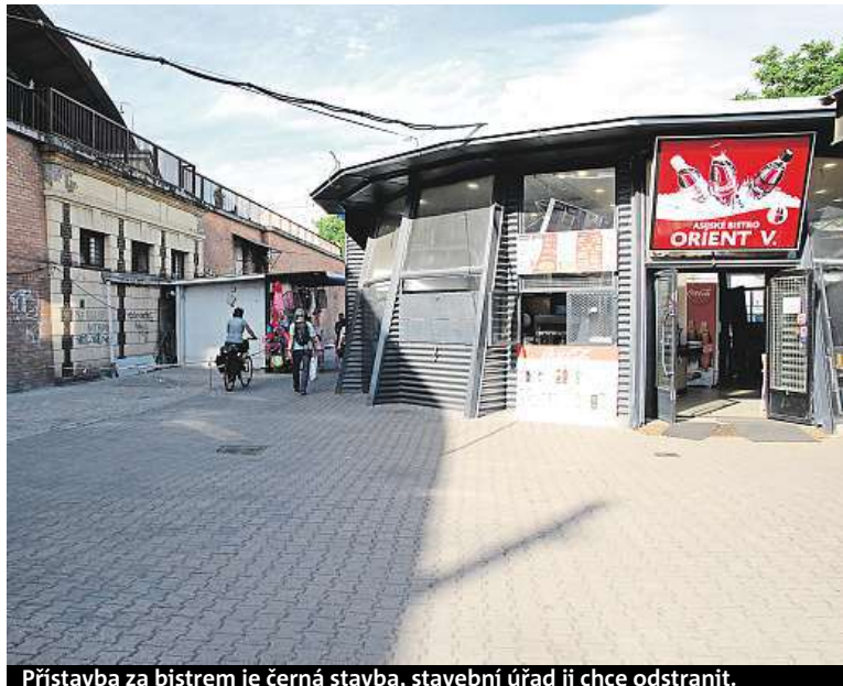
Přístavba za bistroem je černá stavba, stavební úřad ji chce odstranit.