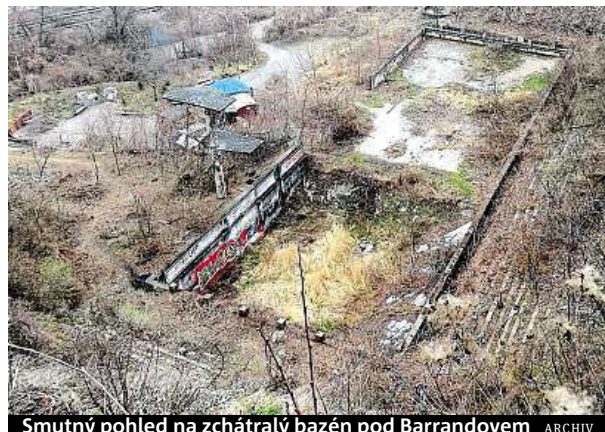
Smutný pohled na zchátralý bazén pod Barrandovem

Pokud si pletete purkrabství s proboštstvím na Hradě, můžete se přijít podívat v pátek 8. července na noční procházku po Pražském hradě. Sraz je ve 20 hodin u sochy