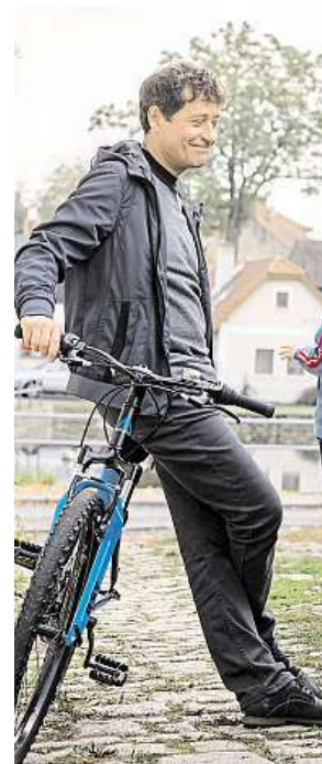
Nechybí ani Básníci. BIOSCOP