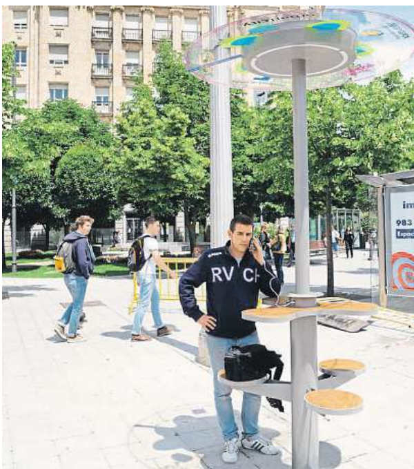
Chytrá palma na dobíjení telefonu

Kromě palem s wi-fi radnice do ankety zařadila také například projekt na doplnění informačních tabulí, rehabilitaci stromových alejí nebo vytvoření nových fontán a pitek. „Tyto projekty nejsou sice zásadní z hlediska chodu čtvrti, a proto nejsou samo-