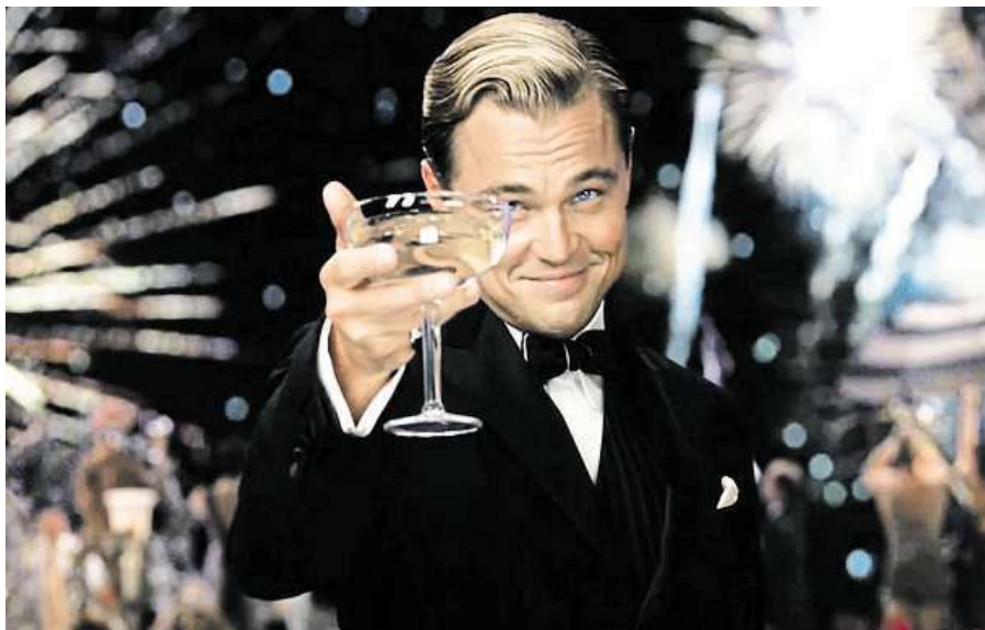
Na film Velký Gatsby se můžete podívat v Riegrových sadech .

Deník Metro pro vás vybral ty nejlepší letní kina v Praze.