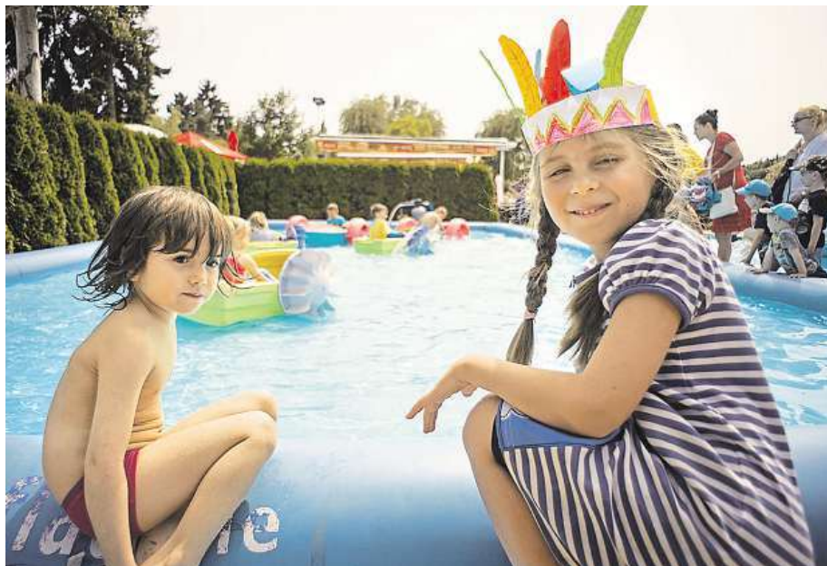
Ve Žlutých lázních seznámí děti s historií prostřednictvím českých bájí a pověstí. ŽLUTÉ LÁZNE