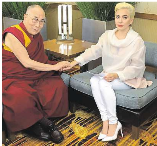
Setkání populární zpěvačky s dalajlámou

Svou podporou dalajlámovi totiž rozzlobila některé obyvatele země, neboť Peking dalajlámou obviňuje z tibetského separatismu. Ten to dlouhodobě odmítá a říká, že usiluje pouze o větší míru autonomie pro svou himálajskou domovinu. Lady Gaga je v Číně díky své popularitě častým předmětem zájmu tisku, ale její sobotní schůzka s dalajlámou zůstala médiu převážně nepovšimnuta.