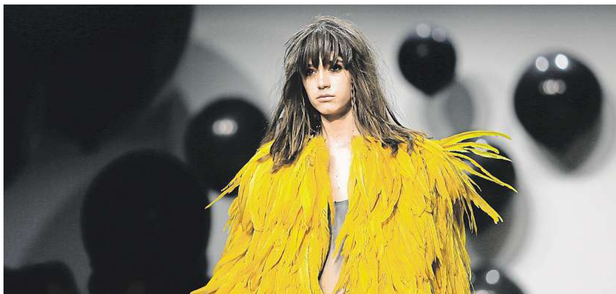
Modelka včera v Berlíně během Fashion Weeku předváděla kolekci Dawida Tomaszewského na jaro/léto 2017.

Křik i facky. Děti se bojí reakce rodičů na známky. Linka bezpečí. Volají hlavně 10–12letí. Sřprávný přístup. Nejvíc funguje pochvala a nabídka pomoci. Odměna? Nejlepší je darovat společný zážitek STRANA 2