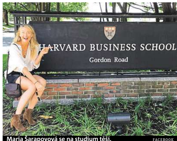
Maria Šarapovová se na studium těší.

V březnu se stala první známou osobností, která oznámila, že měla pozitivní test na meldonium. Ačkoli se bývalá světová jednička a vítězka pěti grandslamů hájila tím, že brala meldonium z lékařských důvodů deset let a nevěděla o tom, že Světová antidopingová agentura WADA lék od začátku letošního roku za-