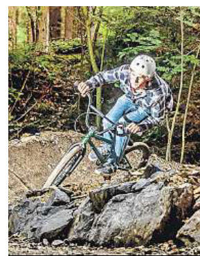
Nový pumpтрек MAFRA

Půvabné město a krajina plná zajímavých míst. Tip na výlet.