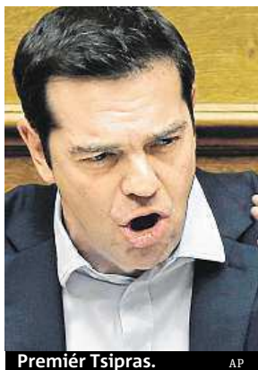
Premiér Tsipras.

Obavy o další budoucnost však způsobily, že Řekové začali v sobotu masivně vybírat peníze z bankomatů. Podle odhadů mohli do sobotního odpoledne vybrat 600 až 700 milionů eur. Výběry během celého víkendu se přitom obvykle pohybují kolem 30 milionů eur. Nyní se čeká, jak Řekové zareagují dnes, a spekuluje se, že by mohli přistoupit k masivnímu výběru vkladů. Mezi analytiky se mluví i o tom, že by řecká vláda mohla dnes nechat za-