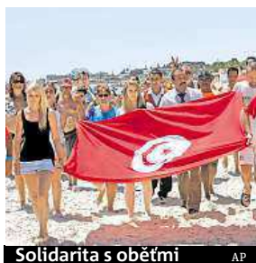
Solidarita s oběťmi

Tunisku hrozí další teroristické útoky na turistická letoviště podobné tomu z pátku, varovalo již včera britské ministerstvo zahraničí. Atentátník zabil v pátek ve městě Súsa 38 lidí a 39 dalších zranil. Policie ho poté zastřelila. Patnáct z identifikovaných obětí jsou Britové. Češi mezi mrtvými ani zraněnými podle všeho nejsou.