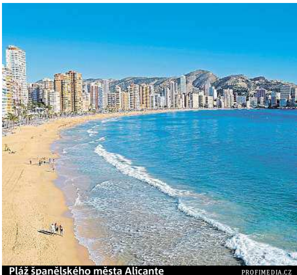
Pláž španělského města Alicante

Třeba ve Španělsku můžete dovolenou strávit tímto způsobem v Alicante. Pulzující město leží v nejjižnější části španělské provincie, mají tu čisté pláže. Občas bývají plnější, proto se můžete svézt tramvají na nedaleký poloostrov. V Alicante stojí hrad na vrchu Benacantil, kde v roce 1247 porazil Alfons X. muslimy. Za uměním můžete vyrazit do Casa de la Asegurada, která hostí díla od Picassa nebo Dalího. Je tu i z nejstarších parků v