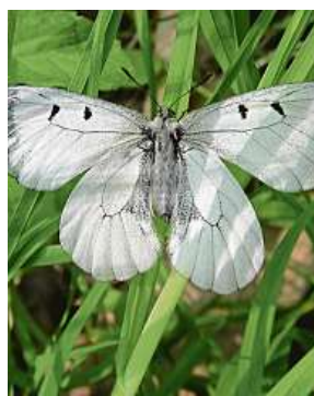
V dřívějším Československu se Jasoň vyskytoval hojně.