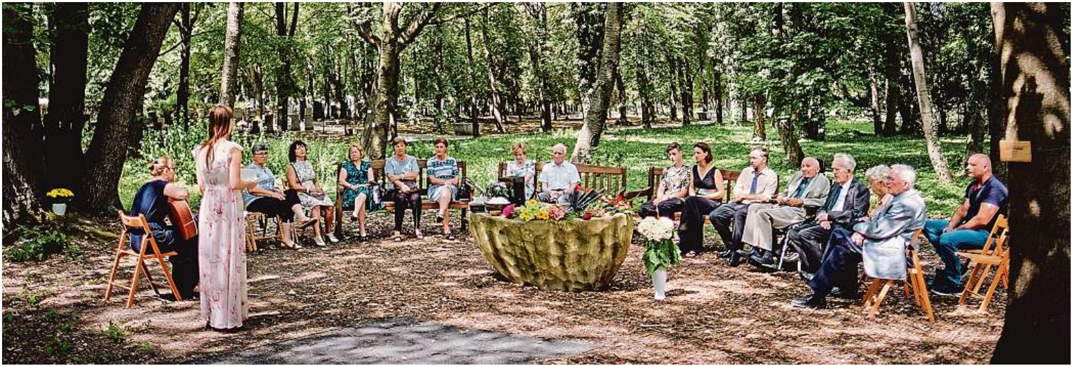
Rozloučení v Lesě vzpomínek