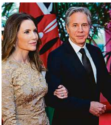
Blinken bude řešit i posílení spolupráce v energetice a obraně.

Pavel se Stoltenbergem v minulosti po tři roky společně působili ve vedení NATO. Bývalý norský premiér Stoltenberg stojí v čele NATO od roku 2014, zástupci členských států mu naposledy loni v létě prodloužili funkční období o další rok do letošního září. Generální tajemník je nejvyšší postaveným civilistou v NATO, reprezentuje Alianci navenek a slouží především jako prostředník. Pavel byl od června 2015 po tři roky předsedou Vojenského výboru NATO, což je nejvyšší vojenský orgán v Alianci. Řád TGM je vysokým státním vyznamenáním České republiky a bývalého Československa. Prezident republiky ho uděluje nebo propůjčuje lidem, kteří se vynikajícím způsobem zasloužili o rozvoj demokracie, humanity a lidských práv. Řád má pět tříd, z nichž nejvyšší je I. třída.