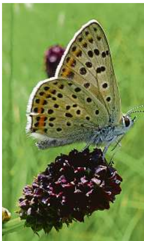
Jasoň dymníkový v Čechách již vyhynul a žije pouze na Moravě.