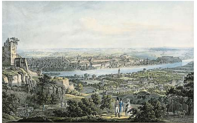
Na vedutě z roku 1830 zachytili Vincenc Morstadt a Josef Šembera Nové Město, Vyšehrad a Smíchov.

SBÍRKOVÝ FOND MUZEA HLAVNÍHO MĚSTA PRAHY