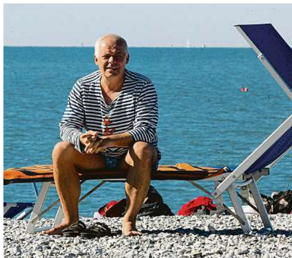
Roman Účastníci zájezdu se odehrává u moře v Chorvatsku. Ale film podle předlohy Michala Viewegha se natáčel na pláži v Itálii.