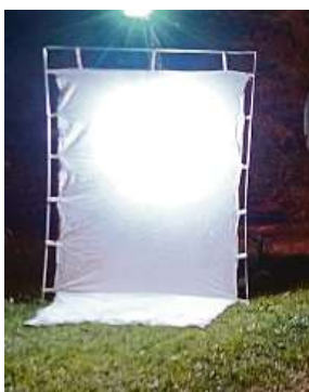
Plachta je při nočním zkoumání hmyzu chytrým pomocníkem.