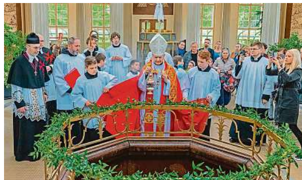
Na začátku května proběhlo ve Františkových Lázních zahájení 231. lázeňské sezony.

Mnoho lidí si také myslí, že lázně jsou určené pouze pro osoby s vážnými zdravotními problémy. Ve skutečnosti lázně poskytují také preventivní a wellness programy, zaměřené na zlepšení celkové kondice, snížení stresu a podporu