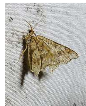
Některé druhy jsou tak malé, že skoro nejdou spatřit okem.