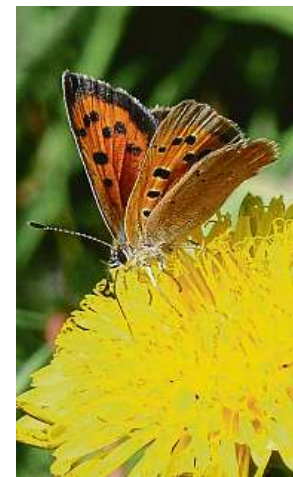
Ohniváček černoskvrnný dostal jméno podle skvrn na křídlech.

Český svaz ochránců přírody přichystal pro zájemce komentované exkurze do přírody. První se koná koncem týdne.