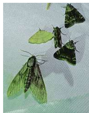
Noční pozorování motýlů na osvětlené plachtě