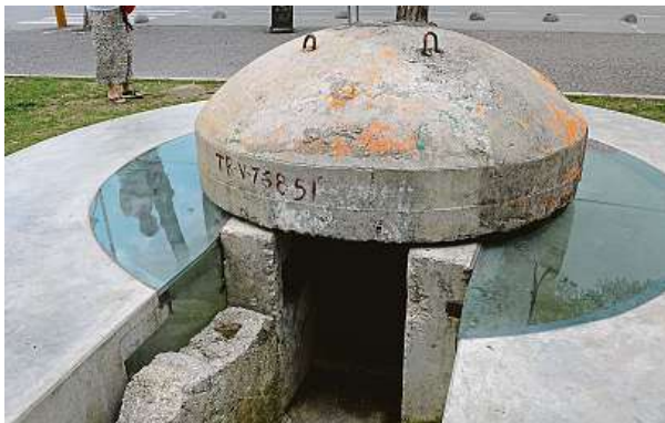
Bunkrů je v Albánii možná víc než hotelů. Pro turisty to jsou vděčné objekty na fotografování.

Kdysi od světa zcela izolovaná země, kterou řídil samovládce Enver Hodža. Albánii máme v povědomí zapsanou spíše jako zemi drogových gangů a skupin, které kradou auta po celé Evropě. A také jako poslední komunistický skanzen kontinentu, posetý tisíci bunkry. V posled-