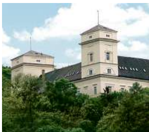
Zámek Račice, přestavba