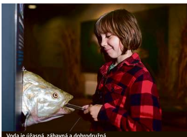
Voda je úžasná, zábavná a dobrodružná.