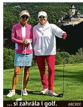
... si zahrála i golf.