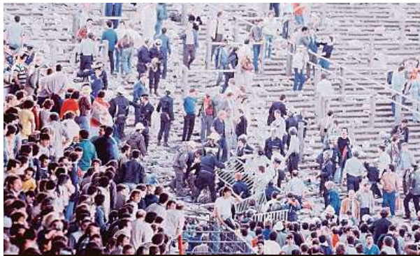
Momentka ze stadionu po masakru