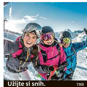
Užijte si sněh. TMR

Výborná zpráva přichází z jediného ledovce v Korutansku. Už příští sobotu otevírá letní sezonu rakouské středisko Mölltaler Gletscher, ve kterém si na své přijdou nejen pěší turisté, ale i lyžaři. Přislíben letních zážitků z ledovce je i avizované otevření rakouských hranic s vybranými zeměmi už v polovině června. Sjezdovky zůstaly bez lyžařů od 15. března, kdy provoz střediska zastavila preventivní opatření na zabránění šíření onemocnění covid-19. Středisko Mölltaler Gletscher během koronavirového uzavření připravilo dvojnásobně větší deponii