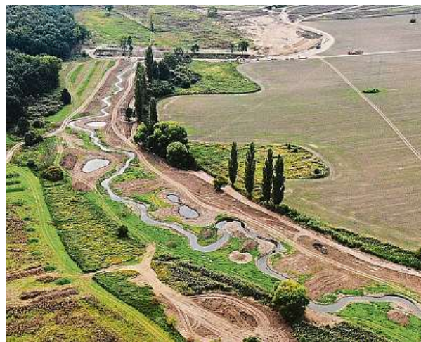
Uměle vytvořené nové meandry a tůňky