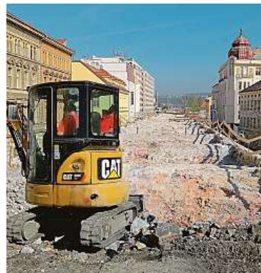
Negrelliho viadukt během rekonstrukce v dubnu 2018 a nyní