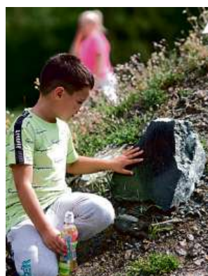
Vodní dům je rájem pro děti.