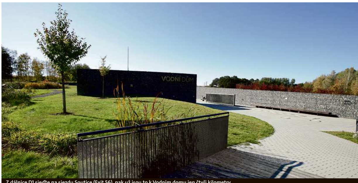
Z dálnice D1 sjedte na sjezdu Soutice (Exit 56), pak už jsou to k Vodnímu domu jen čtyři kilometry.