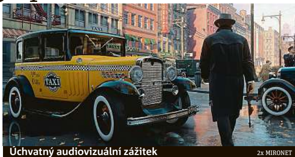
Uchvatný audiovizuální zážitek

První díl série si vyžádal více péče než pouhé grafické vyladění – můžete se proto těšit na zcela předělanou grafiku a zbrusu nový engine, jenž téměř 20 let staré kultov-