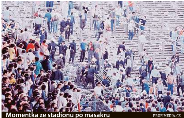
Momentka ze stadionu po masakru