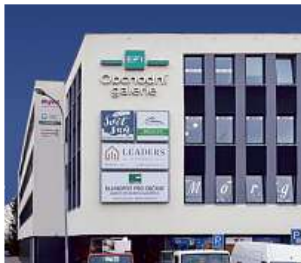
Obchodní galerie, Jihlava