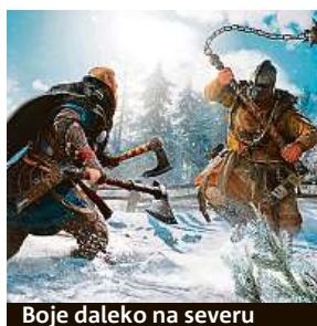
Boje daleko na severu

Severská tematika byla pro většinu z nás donedávna spjata hlavně s filmy a seriály. Díky novému dílu Assassin's Creed Valhalla si však budete moci zažít, jaké je to být vikingem na vlastní kůži. Nebudou chybět brutální souboje jeden na jednoho, ale ani dobývání a osídlování území nebo také starání se o vlastní osadu.