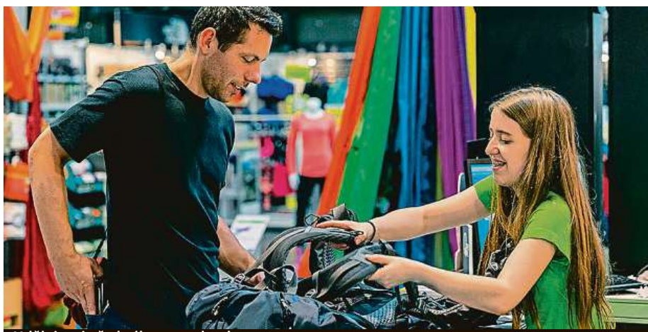
Udělejte si před výletem radost!

Ekologický přístup, moderní technologie a důraz na komfort a design jsou trendy, které současní výrobci nejvíce upřednostňují a jež se projevují napříč celým spektrem nabízeného sortimentu. Lidé tu najdou kromě více než 300 postavených stanů různých konstrukcí a typů stovky modelů turistických bot, sandálů a obuvi pro volnočasové aktivity, kompletní sortiment sportovního oblečení významných českých i světových výrobců, 300 modelů spacáků a stejný počet karimatek, kempingový nábytek napříč všemi kategoriemi i lezecké vybavení a vybavu do