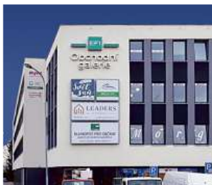
Obchodní galerie, Jihlava