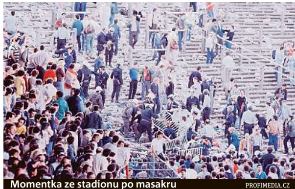
Momentka ze stadionu po masakru