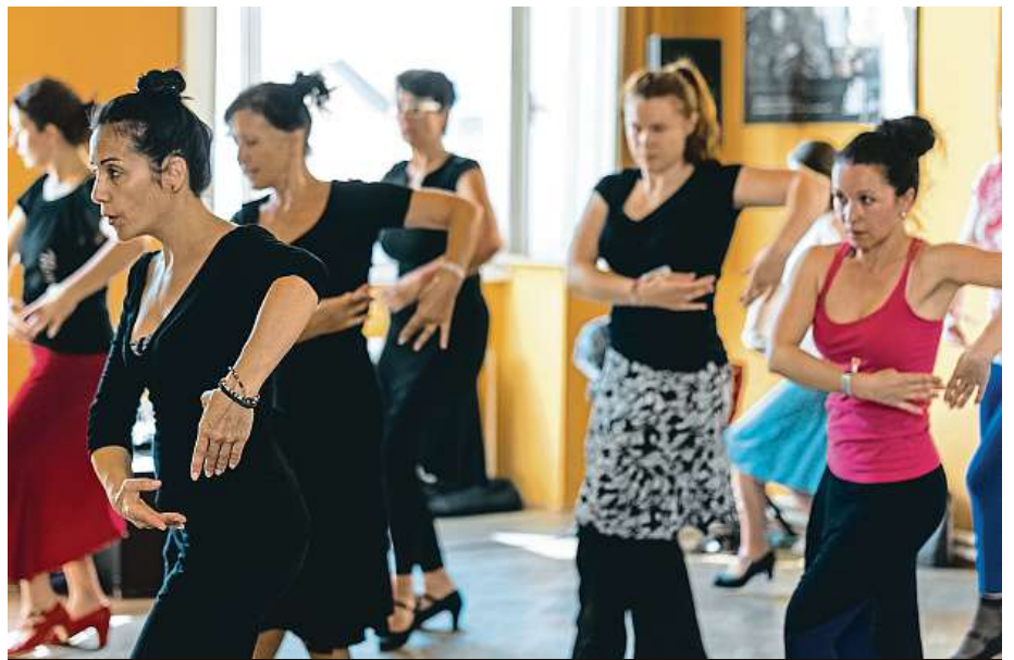
Návštěvníci festivalu se mohou zúčastnit tanečních workshopů.