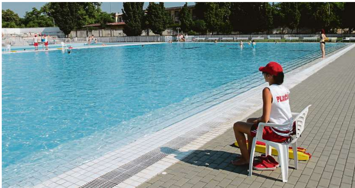
V Zábřdovicích ve dvou padesátimetrových bazénech probíhá i kondiční plavání s kvalifikovaným instruktorem.