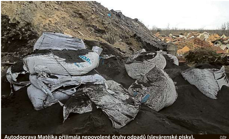
Autodoprava Matějka přijímala nepovolené druhy odpadů (slevárenské písky). ČIŽP

„Při mírně vyšší intenzitě kontrol než v roce 2017 nebylo zjištěno tolik porušení zákona. Tato data opět potvrzují už několikaletý trend rostoucí disciplíny u větších podniků, zejména tedy zhruba