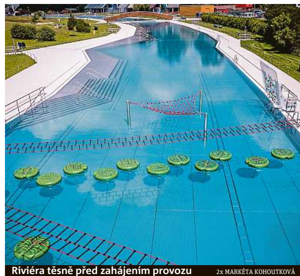
Riviéra těsně před zahájením provozu