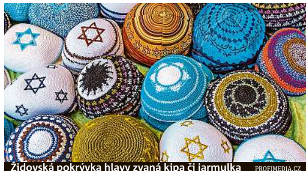
Židovská pokrývka hlavy zvaná kipa či jarmulka

V Berlíně se očekává velká protizraelská demonstrace.