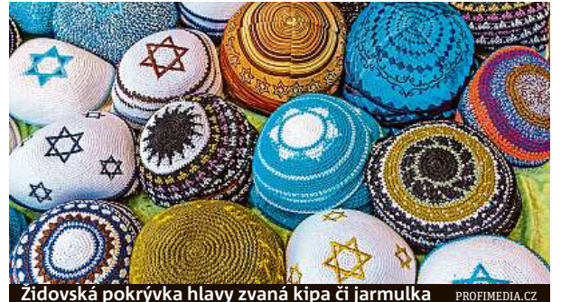
Židovská pokrývka hlavy zvaná kipa či jarmulka

V Berlíně se očekává velká protiizraelská demonstrace.