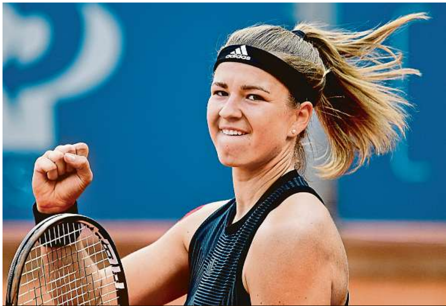
Ve druhém kole se Muchová utká s Rumunkou Beguovou.