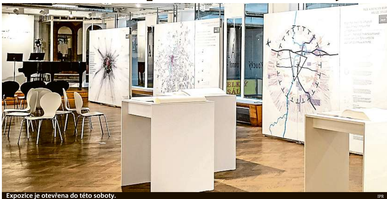
Expozice je otevřena do této soboty.