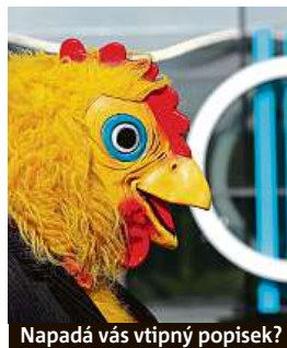
Napadá vás vtipný popisek?

Napište bublinu a reagujte na sloupek na: www.facebook.com/denikmetro