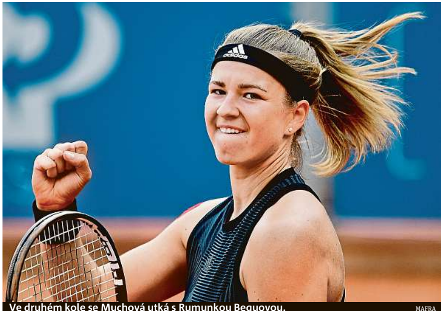
Ve druhém kole se Muchová utká s Rumunkou Beguovou.