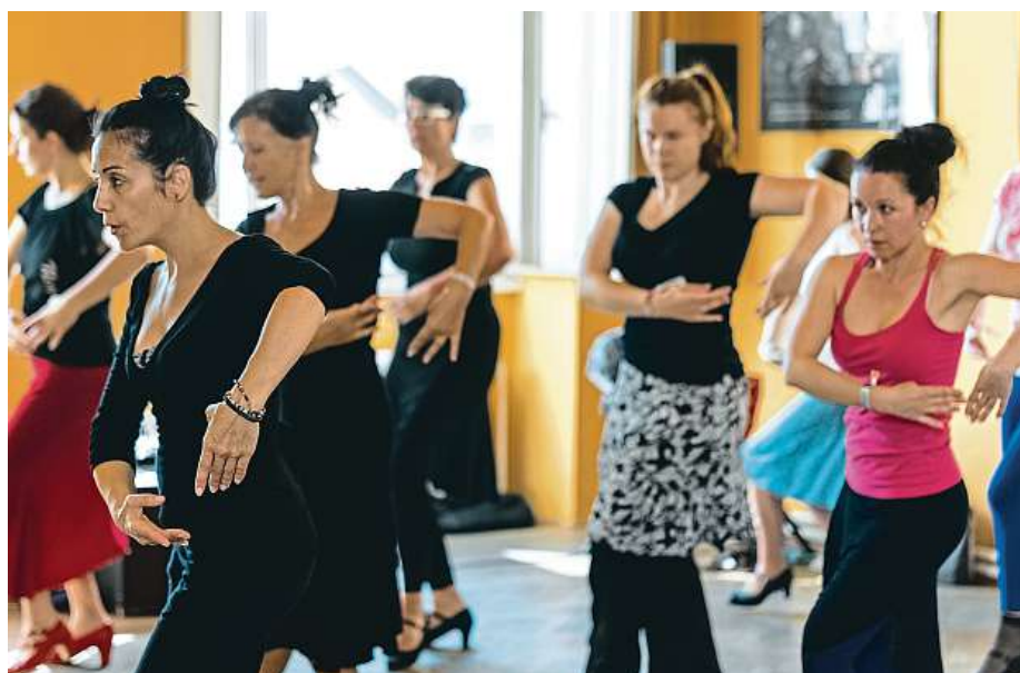
Návštěvníci festivalu se mohou zúčastnit tanečních workshopů.