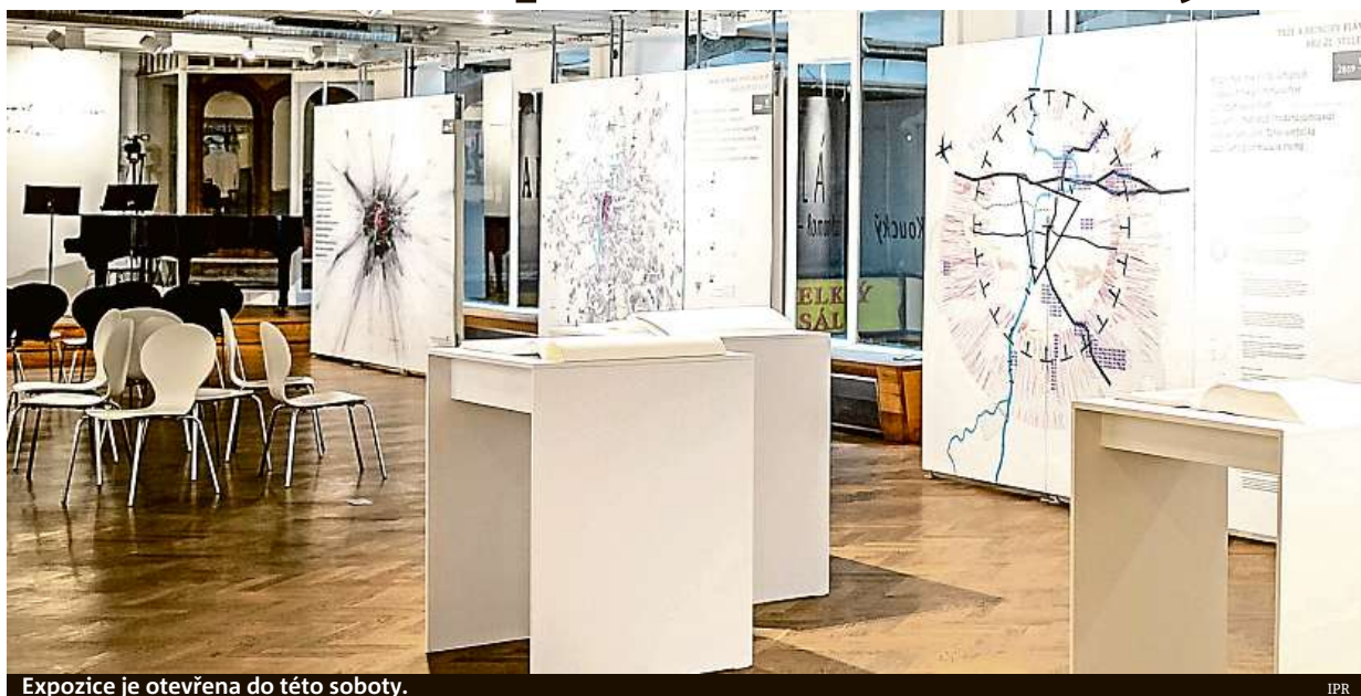
Expozice je otevřena do této soboty.