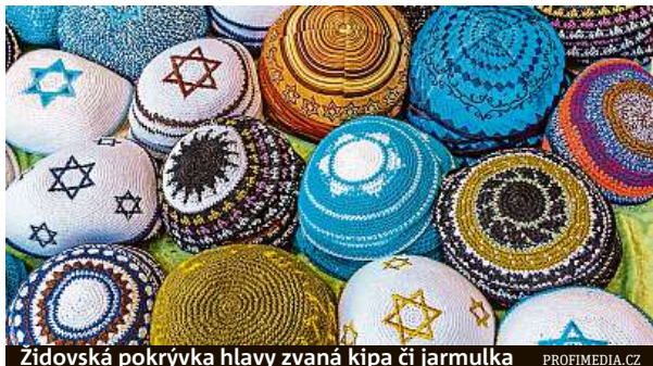
Židovská pokrývka hlavy zvaná kipa či jarmulka

„Když budou politika a společnost proti antisemitismu postupovat společně, pak máme skutečnou šanci tento boj vyhrát,“ řekl Klein. Sobotu pro svou výzvu zvolil kvůli tomu, že se v Berlíně očekávají protiizraelské demonstrace, které se v minulosti zvrhly i v protižidovské výpady. Protesty se uskuteční u příle-