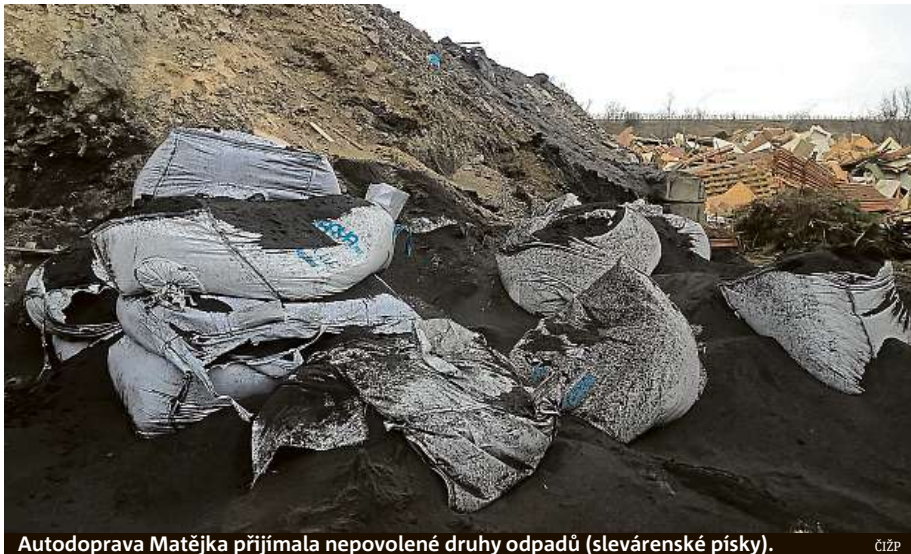
Autodoprava Matějka přijímala nepovolené druhy odpadů (slevárenské písky). ČIŽP

„Při mírně vyšší intenzitě kontrol než v roce 2017 nebylo zjištěno tolik porušení zákona. Tato data opět potvrzují už několikaletý trend rostoucí disciplíny u větších podniků, zejména tedy zhruba