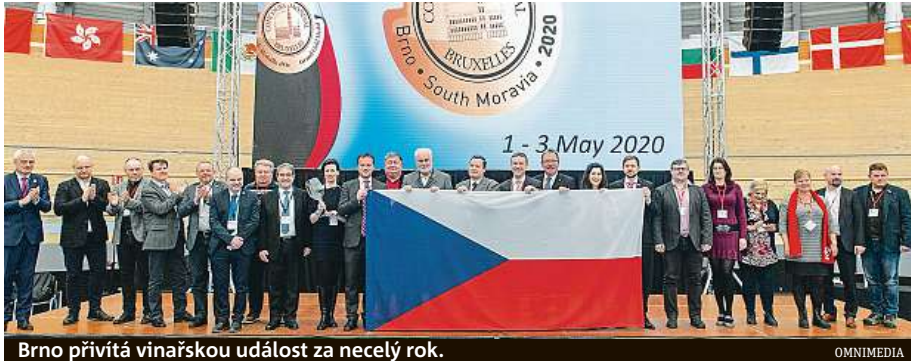
Brno přivítá vinařskou událost za necelý rok.

Brno se v roce 2020 stane hostitelským městem světového klání vín Concours Mondial de Bruxelles.