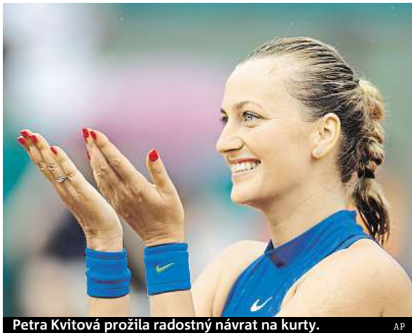
Petra Kvitová prožila radostný návrat na kurty.

Těsně před loňskými Váno- cemi byla Kvitová přepadena ve svém bytě a pachatel jí po- řezal všechny prsty levé