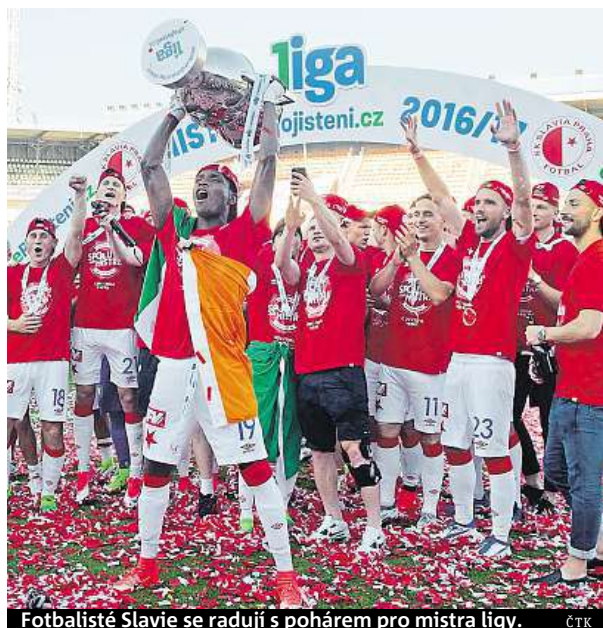
Fotbalisté Slavie se radují s pohárem pro mistra ligy.

První ligu si příští sezonu zahraje Baník Ostrava. Postup mu v posledním kole druhé ligy zajistila výhra 3:0 nad Znojmem. Baník se do první ligy vrací po roce stejně jako Olomouc. PAVEL URBAN