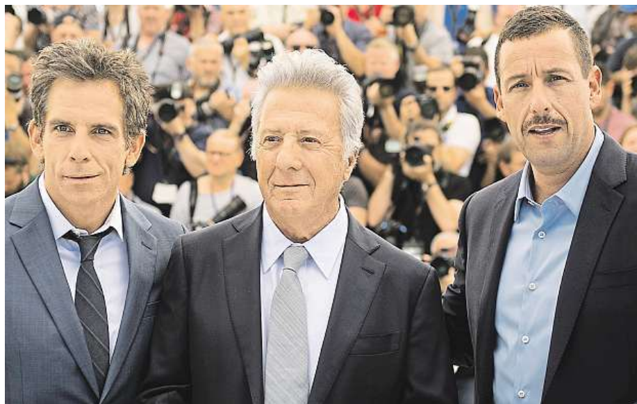
Ben Stiller, Dustin Hoffman a Adam Sandler na filmovém festivalu v Cannes

Také bulvární novináři a fotoreportéři si v rozjařeném květnovém Cannes přišli na své. Vstříc jim vyšla například česká topmodelka Petra Němcová, která na jedné přehlídce předvedla róbu umožňující přítomným mužům zhodnotit i její volbu spodního prádla.