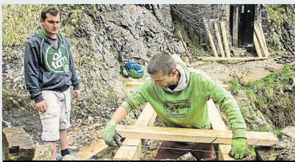
Oprava mostku na modré turistické trase

Cesta Obřím dolem na Sněžku je opět průchozí. Dřevěný mostek u Trkače v Rudné roklí – místu se říká Krakonošova rukavičce – v dubnu nevydržel nápor sněhu a jeden z jeho nosníků se prolomil. Proto ho KRNP před víkendem nechal opravit.