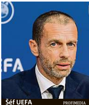
Šéf UEFA

Semifinálové zápasy fotbalové Ligy mistrů hrané současným systémem doma-venku by mohly být za tři roky minulostí. Podle britského deníku The Times se lídři evrop-