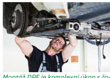
Montáž DPF je komplexní úkon s řadou kroků. Aby filtr bezvadně fungoval musí být provedena precizně, nejlépe v autorizovaném servisu.