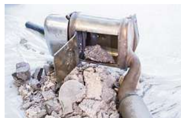
Z DPF testovacího vozu byla odstraněna voštinová keramická vložka s drahými kovy.