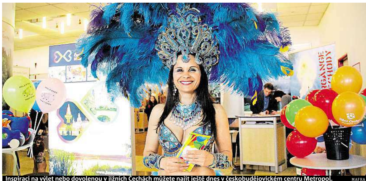
Inspiraci na výlet nebo dovolenou v jižních Čechách můžete najít ještě dnes v českobudějovickém centru Metropol.

Velké akce v Praze. Týkat se budou především uprchlíků. Policie. Bude opět ve stavu nejvyšší pohotovosti. Politické strany. Chystají svá tradiční setkání. Studentský majáles. V plánu je pochod v centru Prahy STRANA 2