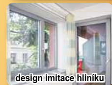
design imitace hliníku