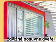
zdvíhací posuvné dveře