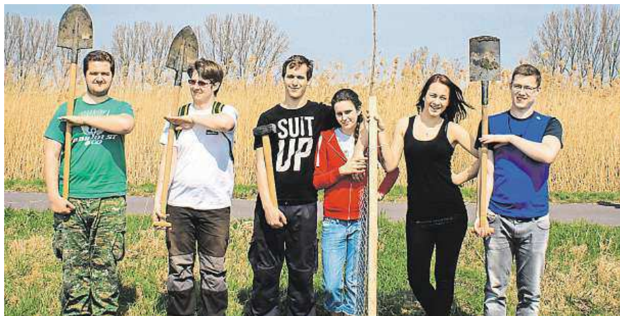
Zaměstnanci firmy při dubnové výsadbě v Jevišovce