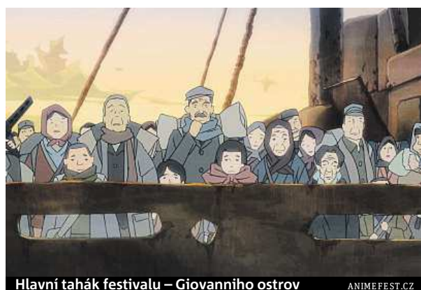
Hlavní tahák festivalu – Giovanniho ostrov