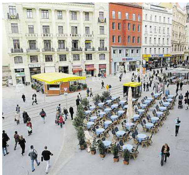
Posedět na zahrádce lze také na náměstí Svobody.

IMPERA styl, a.s. Hlinky 114, Brno www.imperastyl.cz