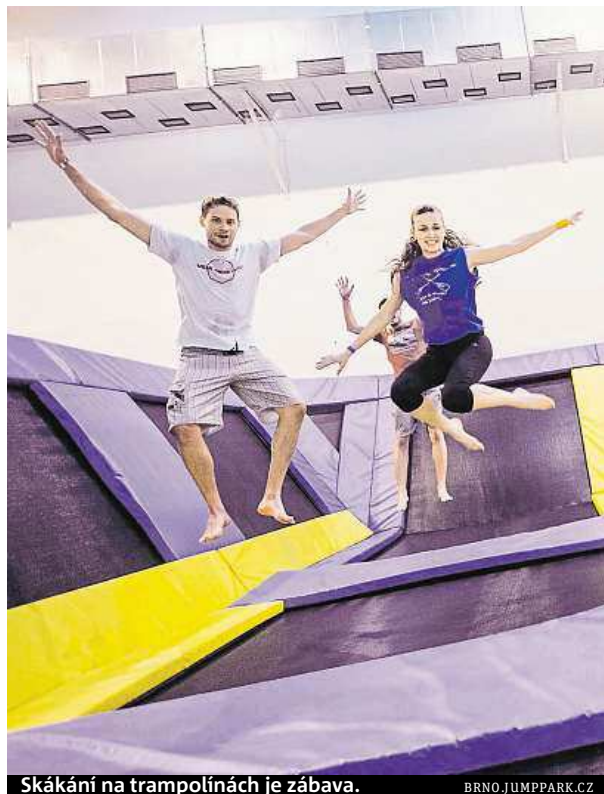
Skákání na trampolínách je zábava.

Pro ty, kteří nevědí, jak správně skákat a jak si návštěvu sami užít, jsou plánovány speciální skupinové aktivity. „Připravujeme skupinovou akci zaměřenou na akrobacii, dále tu bude i aerobic. V plánu jsou také nějaké speciální akce pro děti,“ dodala Plešková. BARBORA ČAPKOVÁ