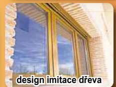
design imitace dřeva