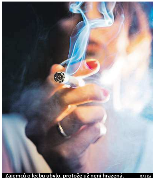
Zájemců o léčbu ubylo, protože už není hrazená. MAIRA

„Doufáme, že v budoucnu se nám podaří apelovat i na mladší skupiny kuřáků,“ přiznává Štefániková. BARBORA ČAPKOVÁ