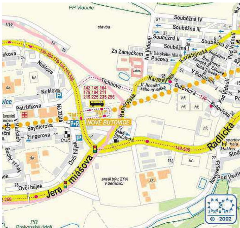
Okolí stanice metra Nové Butovice vypadalo v roce 2002 úplně jinak. ŽAKET