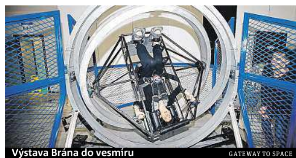
Výstava Brána do vesmíru