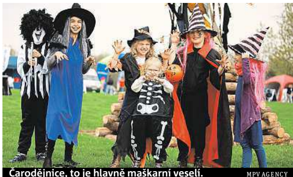
Čarodějnice, to je hlavně maškarní veselí.