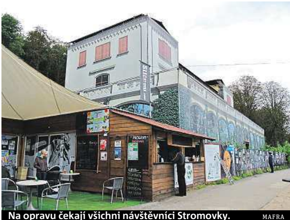
Na opravu čekají všichni návštěvníci Stromovky.

Poslední výběrové řízení zrušilo hlavní město, které je správcem památky, loni. Projekt byl příliš nákladný, počítalo se s opravou za čtvrt miliardy. „Návrh počítal se třemi výtahy, luxusním zázemím a ně-