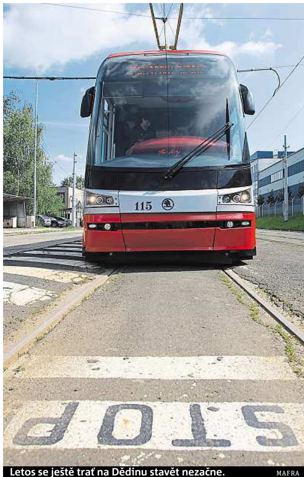
Letos se ještě trať na Dědinu stavět nezačne.

tramvajové trati podporuje, ovšem se třemi podmínkami, kterými vychází vstříc obyvatelům Dědin. Neměla by proto vzniknout nová křižovatka s Evropskou a měl by zůstat zachován obousměrný provoz ve Vlastině ulici. MET