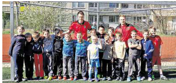
Trenéři s dětmi na tréninku Special One Academy