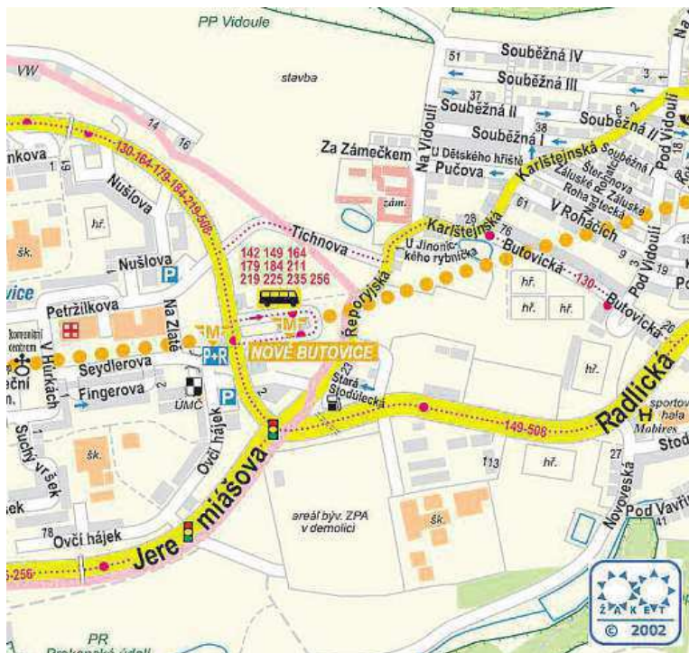
Okolí stanice metra Nové Butovice vypadalo v roce 2002 úplně jinak. ŽAKET