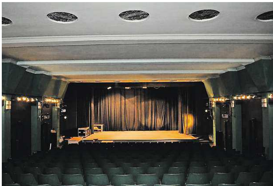
Zda se bude ještě někdy v prostorách kina Ořechovka promítat, je momentálně ve hvězdách.