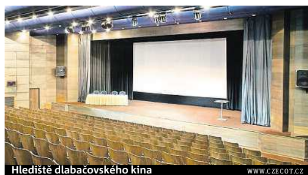
Hlediště dlačovského kina