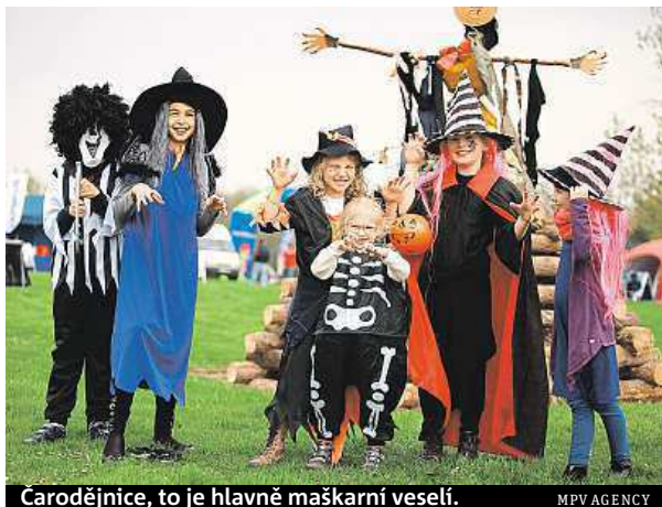
Čarodějnice, to je hlavně maškarní veselí.