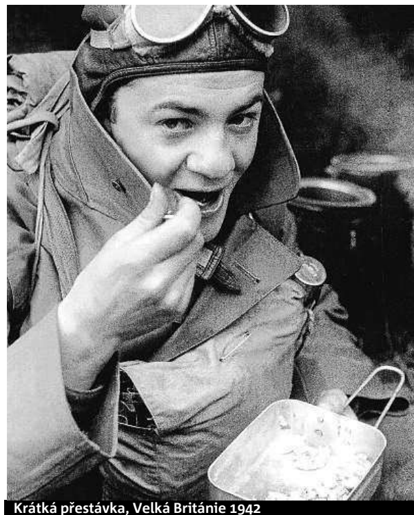
Krátká přestávka, Velká Británie 1942