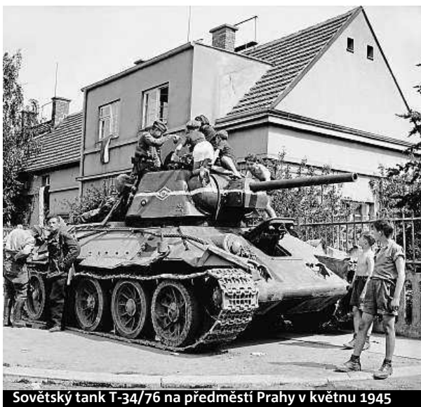
Sovětský tank T-34/76 na předměstí Prahy v květnu 1945