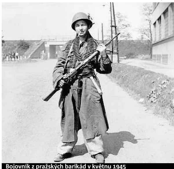
Bojovník z pražských barikád v květnu 1945