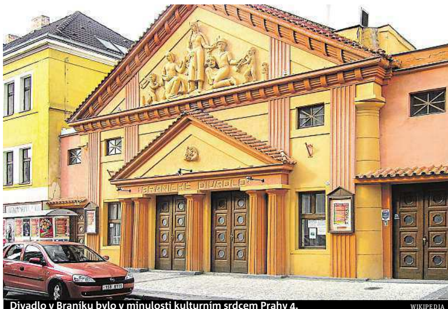
Divadlo v Braníku bylo v minulosti kulturním srdcem Prahy 4.

„Jedna z okolních sousedek se odvolala proti stavebnímu povolení o umístění