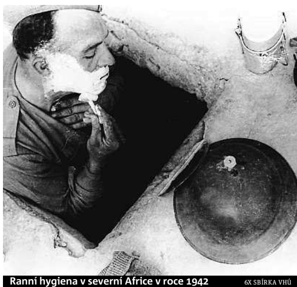
Ranní hygiena v severní Africe v roce 1942