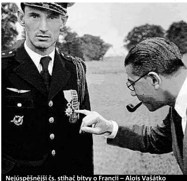
Nejúspěšnější čs. stíhač bitvy o Francii – Alois Vašátko