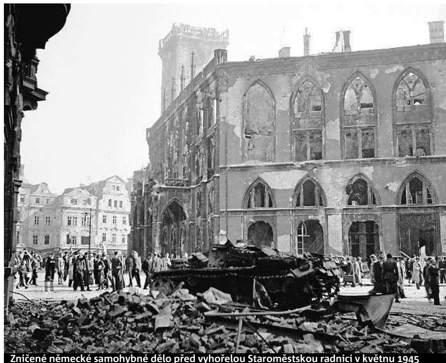
Zničené německé samohybné dělo před vyhořelou Staroměstskou radnicí v květnu 1945