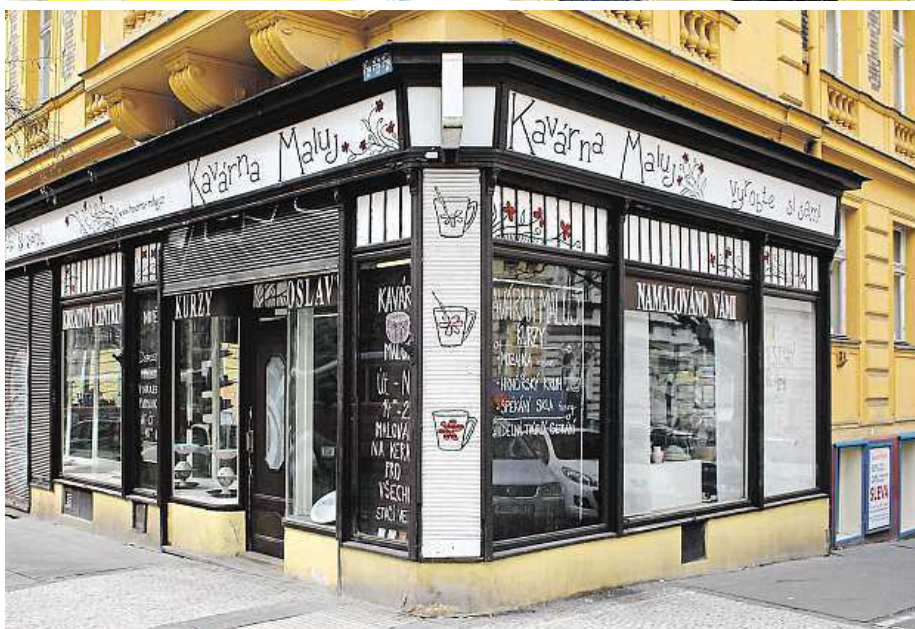
V kavárně Maluj ve Vinohradech se každý týden pořádají výtvarné kurzy.