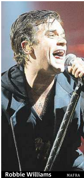
Robbie Williams

Jestliže fanoušci festivalu Sziget nevyužijí zvýhodněnou cenu vstupenek, která