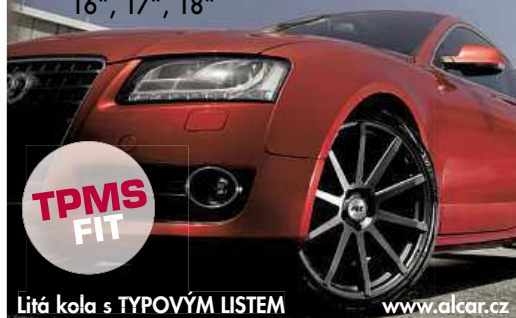
DEZENT TG dark 16", 17", 18"