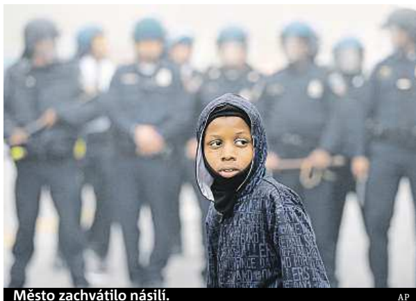
Město zachvátilo násilí.

mřel 19. dubna na následky zlomeniny krčních obratlů, kterou utrpěl o týden dřív při zatýkání. Policie připusti-