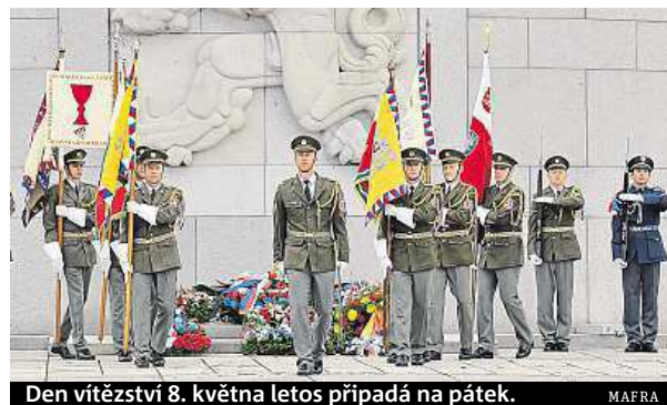
Den vítězství 8. května letos připadá na pátek.