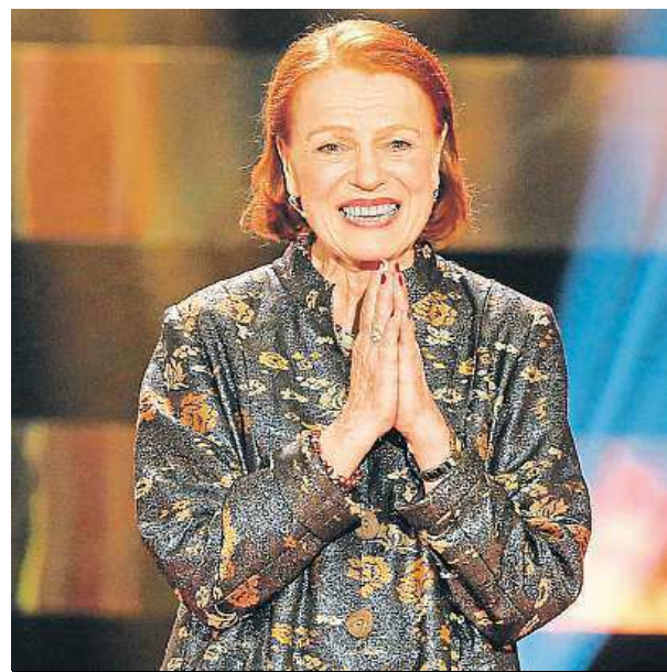
Iva Janžurová při uvedení do Síně slávy