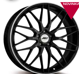
AEZ Crest dark