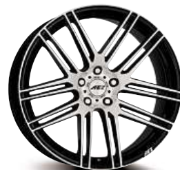
AEZ Cliff dark