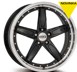
DOTZ SP5 dark