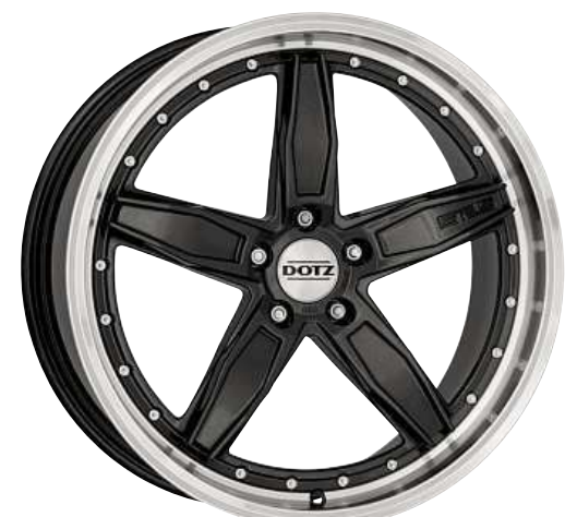
DOTZ SP5 dark