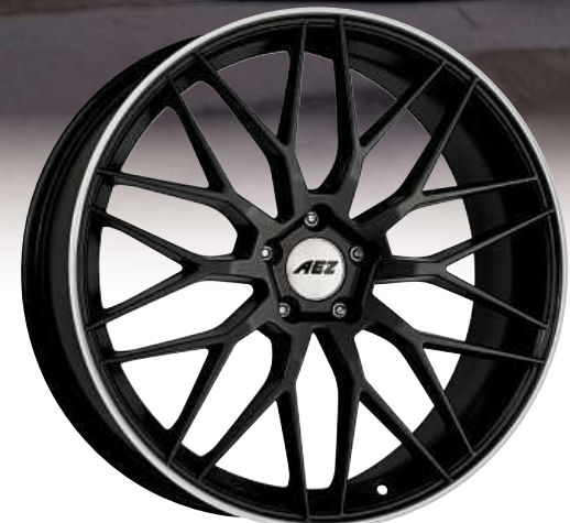
AEZ Crest dark