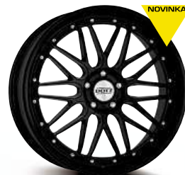
DOTZ Revvo black