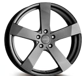
DEZENT TD graphite