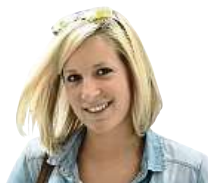
TROTAMUNDOS VĚČNÁ CESTOVATELKA A OBDIVOVATELKA ZAJÍMAVÝCH KULTUR

Mám k místním velký respekt, takže jsem neoponovala, ale v duchu si myslela své.