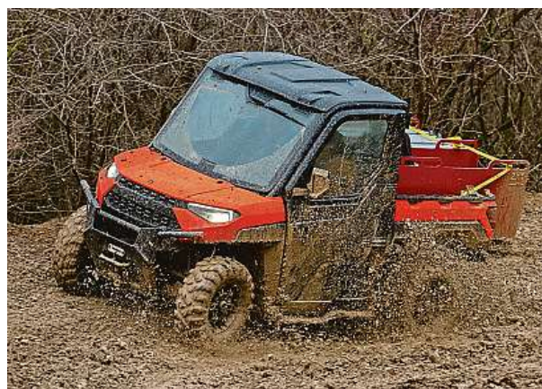
Výkon 82 koňských sil a vysoký krouticí moment zajistí to, že se agilně dostanete i z hlubokého kluzkého bahna. POLARIS