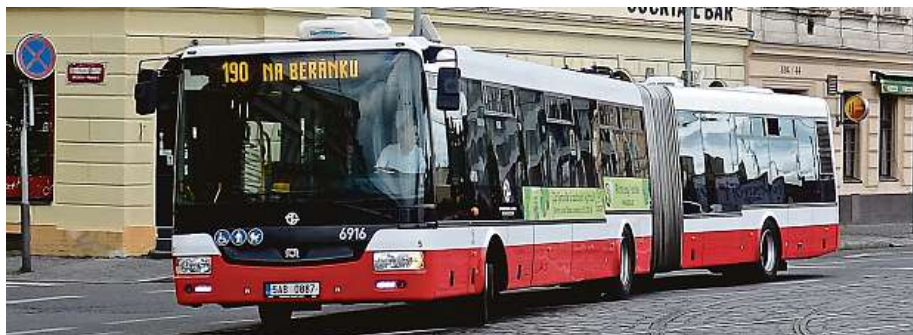
Autobusovou linku čekají změny. Situace je podobná jako v případě zprovoznění tramvají do Libuše. Změna zde vedla k ukončení provozu souběžné autobusové linky 165. I tehdy místní protestovali.

Podobných situací řešil deník Metro v minulosti mnoho. Dokonce by se dalo hovořit o modelové. Modřanští tvrdí, že se nemohou domoci informací ani od radnice Prahy 12, natož od ROPID či dopravního podniku. Proto chtějí za svá práva bojovat peticí. „Celé to působí dojmem, že je snaha plánovanou změnu před cestujícími zatajit a počkat, až bude vše hotovo bez možnosti výsledku nějak ovlivnit. Přitom linka 190 má být z těch, které jezdí na Smíchovské nádraží, zrušena