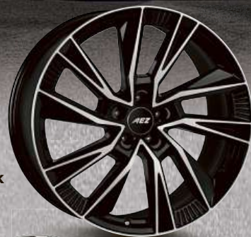
AEZ Havanna dark 19"–21"