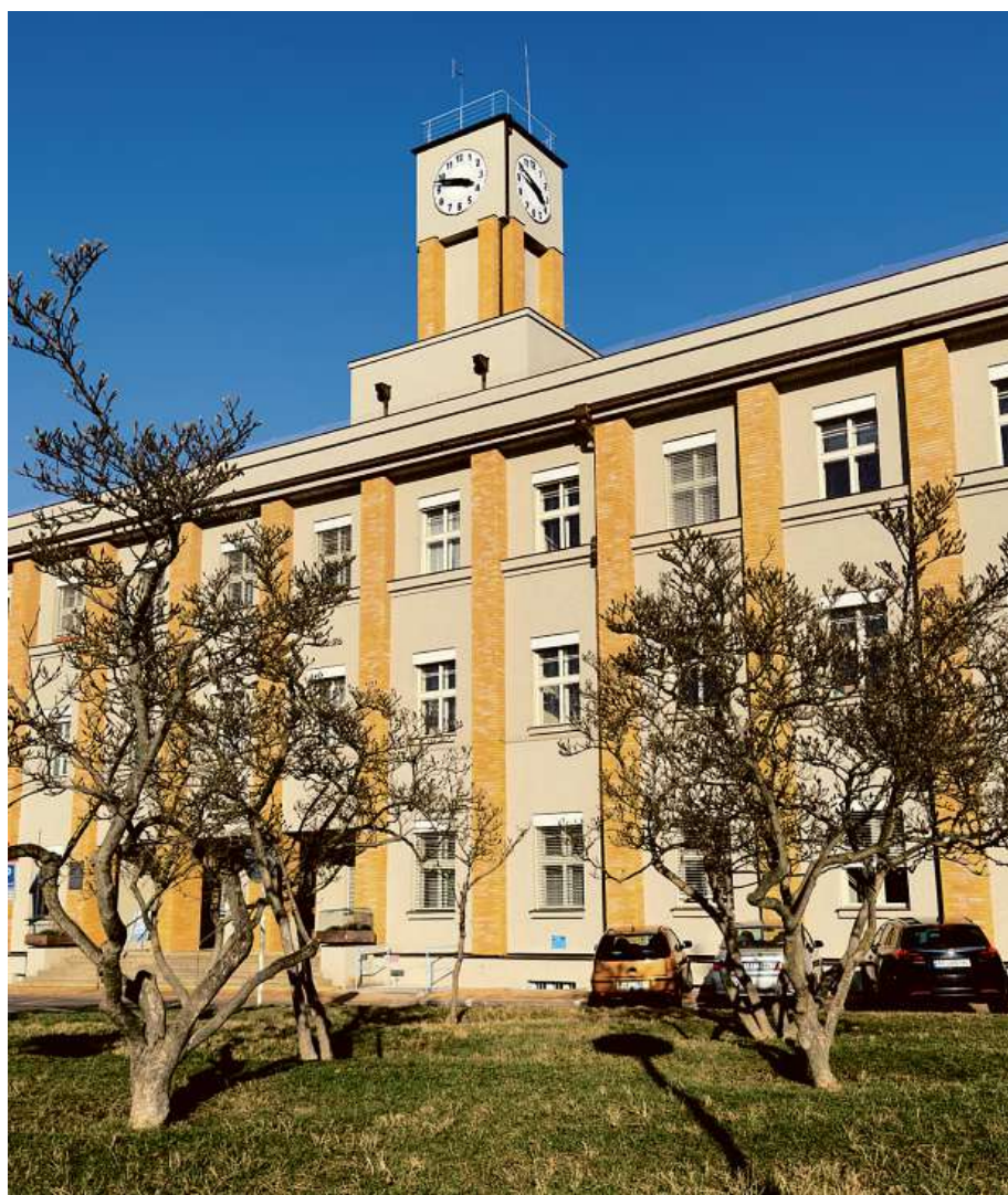
Nová čistírna v areálu Fakultní Thomayerovy nemocnice každý den vyčistí 100 m 3 odpadních vod.

Pomocí nových technologií bude voda na odtoku z ne-