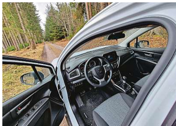
Interiér je prostorný. Výtku máme k vyšší hlučnosti v interiéru při vyšších rychlostech. Volit lze mezi manuálem a automatem. 2x METRO

Suzuki S-Cross 1.4 BoosterJet Hybrid 4x4. Haldou kilometrů prověřený technický základ, který před dvěma lety dostal novou kastli. Jak jezdí klasika od Suzuki? Vyzkoušeli jsme ji v týdenním testu.