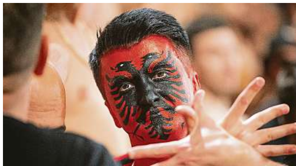
Češi objevují Albánii. Nejen proto, že v kvalifikaci na Euro 24 skončili naši fotbalisté až za ní. Stále častěji míří do Albánie i za turistikou.

Analýza prodeje letenek v lednu a první polovině února ukázala, že počet prodaných letenek na období Velikonoc 2024 vzrostl o šest procent ve srovnání s loňským rokem. Tento trend nazývá na rok 2023, který přinesl dvanáctiprocentní oživení zájmu o cestování letadlem ve srovnání s rokem 2022. Vyplývá to z analýzy společnosti Student agency travel. Ceny letenek na Velikonoce 2024 ukazují zajímavé trendy. Cena zpáteční letenky do Paříže klesla oproti loňsku o 14 procent, na průměrných 6342 korun. Letenky do Amsterdamu naopak zaznamenaly nárůst o osm procent s průměrnou cenou 6938 korun. Letenky do Londýna překvapily největším poklesem, kdy průměrná cena letenky klesla o 21 procent – na 6119 korun. MET