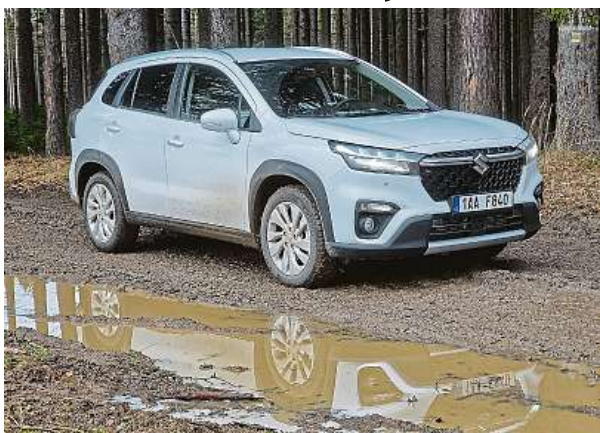
Zavazadlový prostor nabízí 430 litrů, stejně jako u předchozí verze modelu. Nechybí ani variabilní mezipodlaha, kterou lze vyjmout.