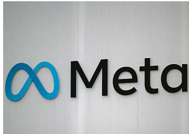
Společnost Facebook se přejmenovala na Metu. Nové jméno odkazuje na internetový svět, který společnost buduje.

Pokud jde o vliv na mladé lidi, tento krok by mohl mít podle něj smíšené důsledky. „Na jedné straně by mohl pomoci chránit mladé uživatele před polarizujícím nebo škodlivým obsahem a dezinformacemi. Na druhou stranu omezení přístupu k politickému obsahu by mohlo také ztížit jejich schopnost informovat se o politických otázkách, což je klíčové pro formování informovaných občanů a budoucích voličů,“ konstatuje Janda. Důležité bude, jak přesně Meta definuje politický obsah a jaké alternativní zdroje informací si mladí lidé najdou.