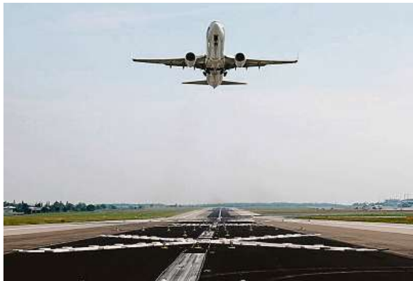
Do některých oblíbených destinací v Evropě cestovali Češi autem. Přibývá ale těch, kteří si raději zaplatí cestu letadlem.

Většina cestovek potvrzuje, že objednávka na čtyři a pětihvězdičkové ubytování