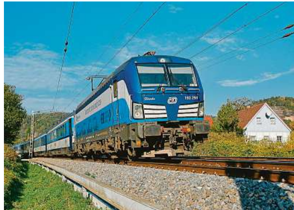
České dráhy uzavřely s dceřinou společností Telematika smlouvu na výměnu nejstarších routerů za novou, výkonnější technologii.