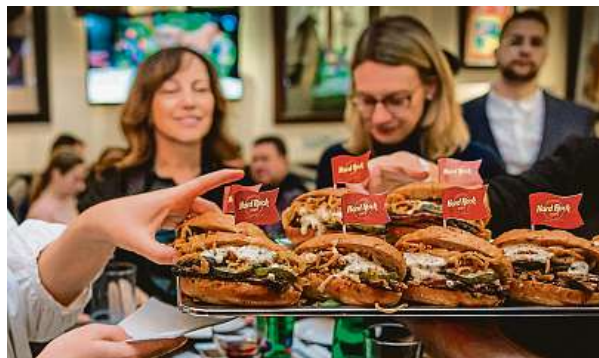
Některé speciality už jsou k ochutnání.

Než ale celá třídní oslava vypukne, čeká na milovníky BBQ a grilovaných pochoutek řada akcí. Smoke & Fire Food Fest nebude jen dalším