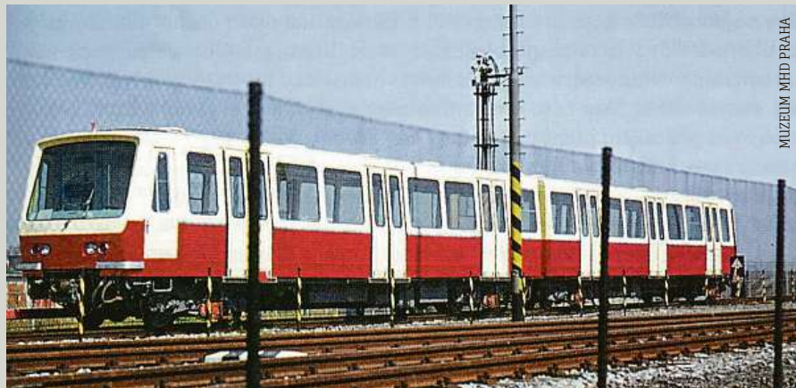
MUZEUM MHD PRAHA

Metro letos oslaví 50 let provozu. Muzeum MHD Praha u toho nemůže chybět. Na Facebooku už zveřejnilo nejrůznější zajímavosti. Tohle je například prototyp metra R1 z Tatry Smíchov. Představen byl veřejnosti v lednu 1971. Snímek jej zachycuje na zkušební trati na Kačerově téhož roku. Do výroby se vozy nedostaly, důvodem bylo vyřízení Tatrovky výrobou tramvají. MET