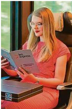
„Funkční wi-fi není sci-fi!“ hlásí železniční dopravci. LEO EXPRESS

„Kvalitní připojení k internetu je jednou z nejžádanějších služeb ze strany objednatelů veřejné dopravy. Vlak je pak možné využít jako pojižd-