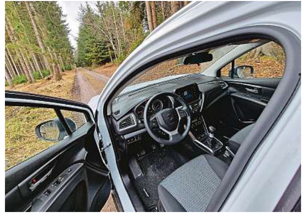
Interiér je prostorný. Výtku máme k vyšší hlučnosti v interiéru při vyšších rychlostech. Volit lze mezi manuálem a automatem. 2x METRO

My jsme si k testu vzali jeden ze dvou nabízených motorů – přepínaný zážehový 1,4litrový BoosterJet se čtyřmi válci s 48V mild-hybridním pohonem. Motor kombinuje přímé vstřikování a přepínání turbodmyčadlem.