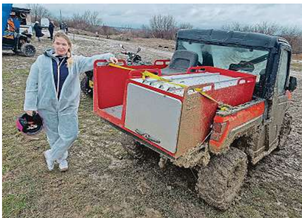
Korba s nosností téměř půl tuny umožňuje zajímavé zástavby. Hasičský speciál dostal nádrž na vodu, box a koleje na nosítka.