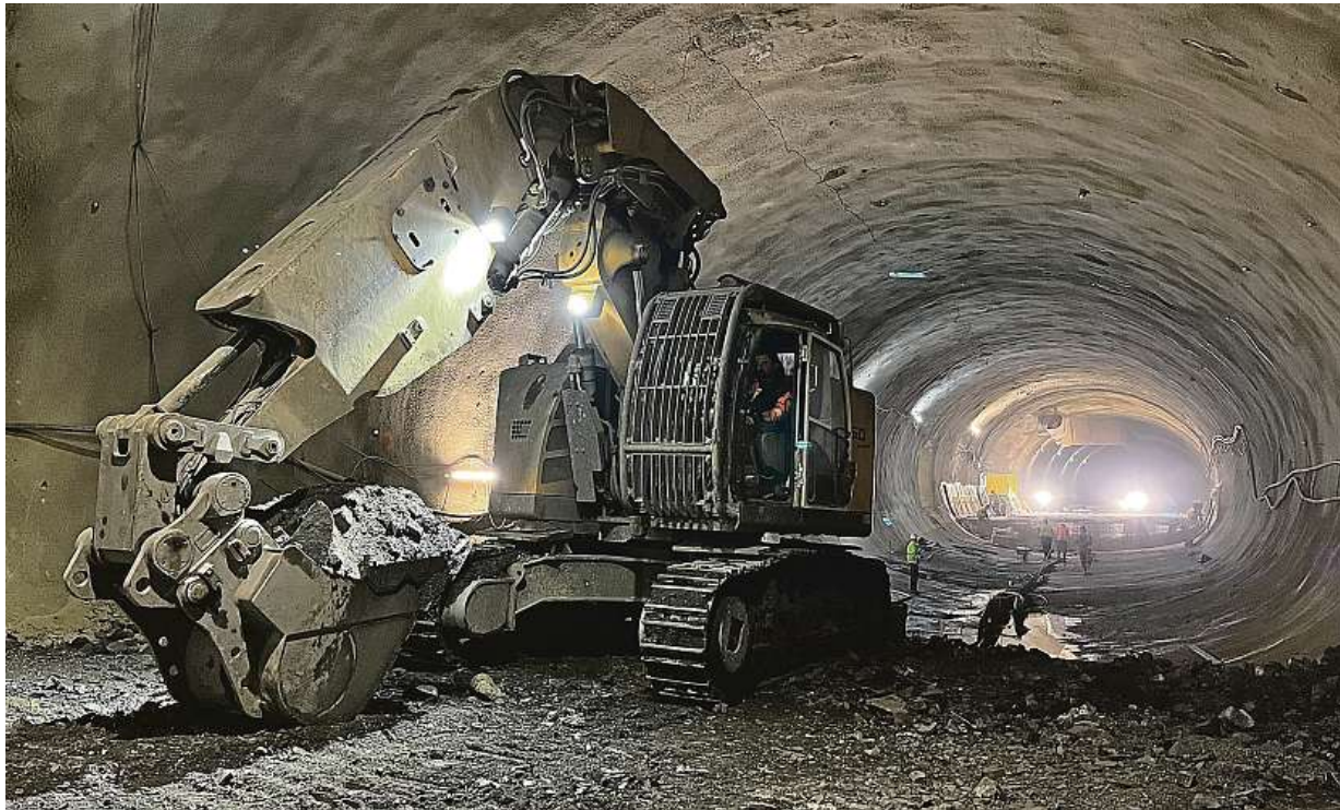
Zhruba v těchto místech vzniknou obrátové koleje pro metro. Ve tmě v dálce bude zase stanice Pankrác.