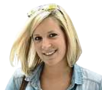
TROTAMUNDOS VĚČNÁ CESTOVATELKA A OBDDIVOATELKA ZAJÍMAVÝCH KULTUR

Mám k místním velký respekt, takže jsem neoponovala, ale v duchu si myslela své.