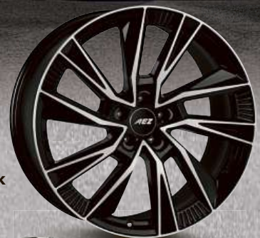
AEZ Havanna dark 19"–21"