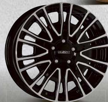
DEZENT KE dark 16"–18"