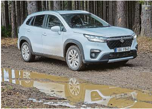
Zavazadlový prostor nabízí 430 litrů, stejně jako u předchozí verze modelu. Nechybí ani variabilní mezipodlaha, kterou lze vyjmout.

Suzuki S-Cross 1.4 BoosterJet Hybrid 4x4. Haldou kilometrů prověřený technický základ, který před dvěma lety dostal novou kastli. Jak jezdí klasika od Suzuki? Vyzkoušeli jsme ji v týdenním testu.