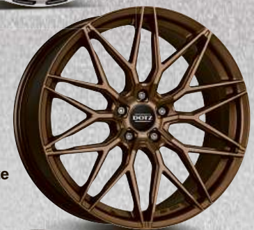
DOTZ Suzuka bronze 18"–20"