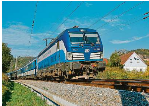
České dráhy uzavřely s dceřinou společností Telematika smlouvu na výměnu nejstarších routerů za novou, výkonnější technologii.

nou kancelář, snadno se dá surfovat po sociálních sítích a vyřizovat maily a další zprávy. Wi-fi jsme zavedli ve vlacích Českých drah už před delší dobou, a tak je původní technologie už v mnoha ohledech přežitá,“ říká generální ředitel Českých drah Michal Krapinec a dodává, že se s kolegy rozhodli provést výměnu za moderní, výkonná zařízení, která posílí připo-