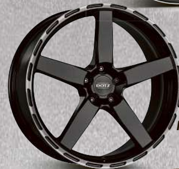
DOTZ MarinaBay dark 18"–21"