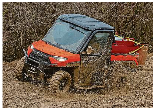
Výkon 82 koňských sil a vysoký krouticí moment zajistí to, že se agilně dostanete i z hlubokého kluzkého bahna. POLARIS

Ale ani tak nejsme žádná ořezávátka. Náš hasičský terénní speciál má světlou výšku 33 cm a litrový dvouválco-