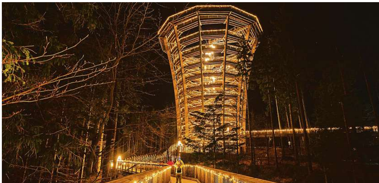
Atraktivní zážitek pro celou rodinu