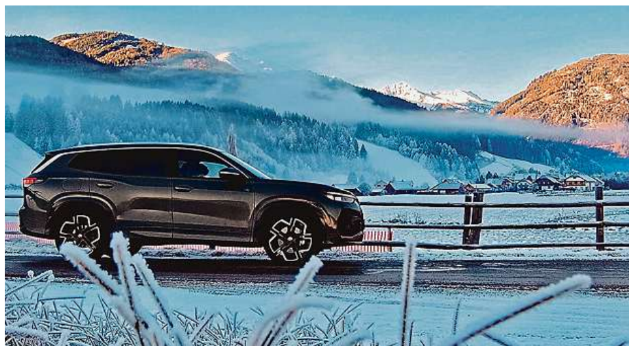
Namrzlé ranní silnice v Alpách nemusí být pro strach, čtyřkolka od Volkswagenu si poradí.

A k tomu přidejte design: R-Line v zelené metalíze Cipressino vypadá fakt dobře. Nenápadně prémiově, sebevě-