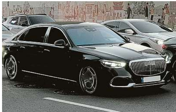
Západ je nepřítel, v případě luxusu jde ruská národní hrdost stranou. Západní prémiové vozy jsou toho příkladem. WIKIMEDIA COMMONS

Rusové sice zaplatí za luxusní limuzíny a SUV horentní sumy včetně vysokých „národních celních“ poplatků,