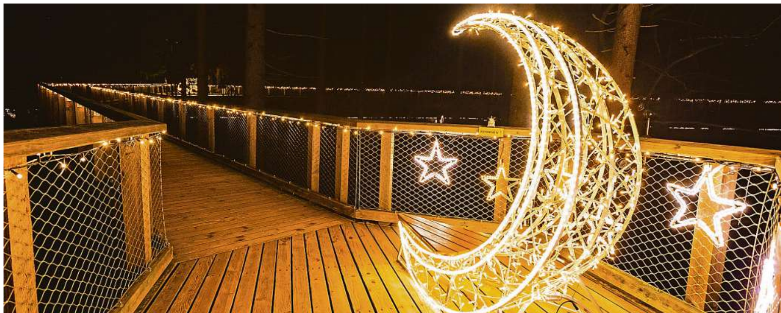
Světelné zimní hry se po loňské sezóně vrací na Stezku korunami stromů v Krkonoších.

Světelné zimní hry vznikají s ohledem na chráněné horské prostředí, vše probíhá v úzké spolupráci se Správou Krkonošského národního parku, využity jsou energeticky úsporné technologie. „Respektujeme charakter místa a minimalizujeme světelnou zátěž,“ doplňuje Poláčková z Decoledu s tím, že projekt v Janských Lázních potrvá do 15. března. DAVID HALATKA