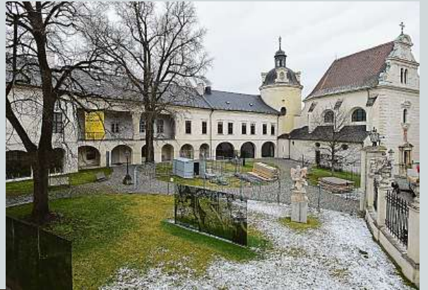
Chystají se opravy jedné z nejceněnějších románských památek ve střední Evropě.