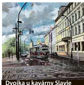
Dvojka u kavárny Slavivka