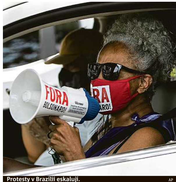
Protesty v Brazílii eskalují.

Nespokojenost přitom narůstá i v Bolsonarově táboře. On-line petice propagovaná bývalými konzervativními příznivci přilákala za tři dny více než 180 tisíc podpisů požadujících odstoupení Bolsonara. Tato petice poukazuje i na fakt, že v posledních dnech zemřely v Manausu,