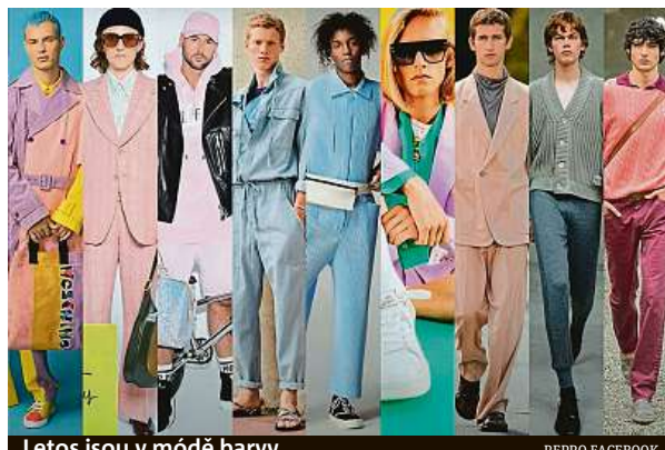
Letos jsou v módě barvy.

Veselo bude i v případě pánských šatníků. Styloví čeští