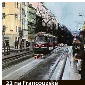
22 na Francouzské