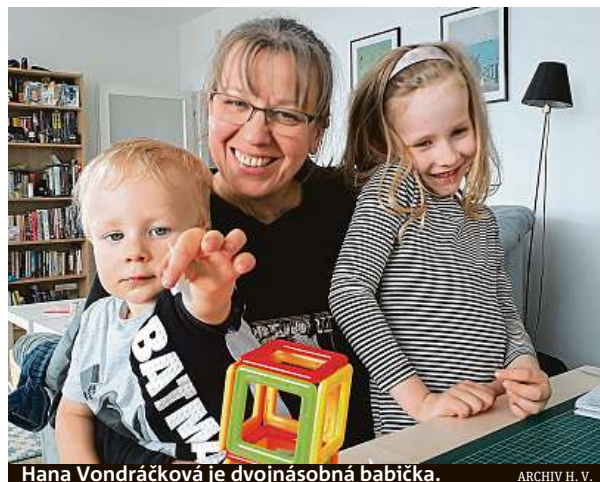
Hana Vondráčková je dvojnásobná babička.

Dcera mě přiměla založit si účet na sociálních sítích a pomohla příběhy nasdílet. Mám díky tomu odezvu od lidí, kteří něčím podobným procházejí nebo jim má příběhy jen zvednou náladu po náročném dni. Musím říct, že mě to neskutečně nabíjí. Všech-