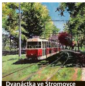
Dvanáctka ve Stromovce