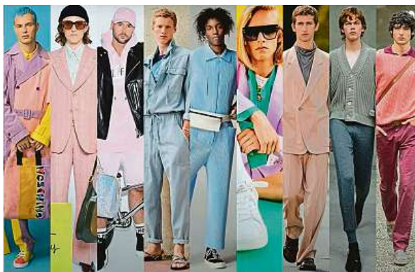
Letos jsou v módě barvy.

Veselo bude i v případě pánských šatníků. Styloví čeští