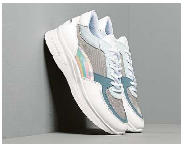
Tenisky jako půjčené od táty