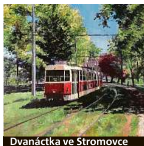
Dvanáctka ve Stromovce