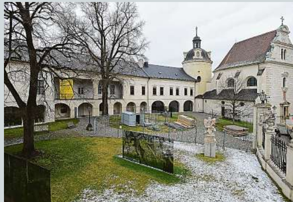
Chystají se opravy jedné z nejceněnějších románských památek ve střední Evropě.