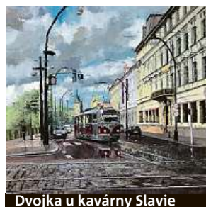
Dvojka u kavárny Slavie