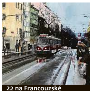
22 na Francouzské