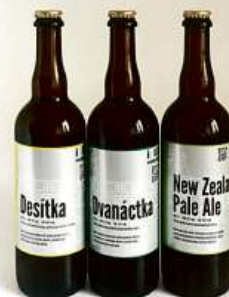
Prodej řemeslných piv v balení sklo, PET a KEG s možností zapůjčení výčepu