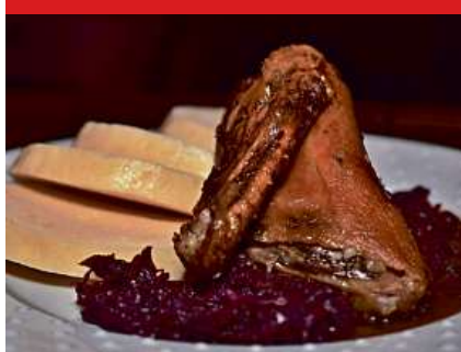
Čtvrtka pečené kačeny se zelím