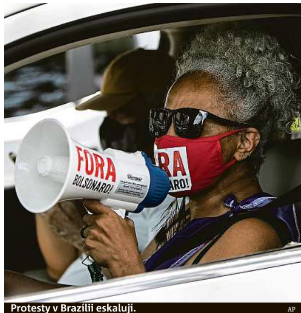
Protesty v Brazílii eskalují.

Nespokojenost přitom narůstá i v Bolsonarově táboře. On-line petice propagovaná bývalými konzervativními příznivci přilákala za tři dny více než 180 tisíc podpisů požadujících odstoupení Bolsonara. Tato petice poukazuje i na fakt, že v posledních dnech zemřely v Manausu,