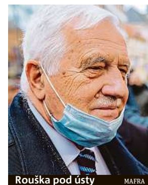
Rouška pod ústy

razně doporučují lidem dodržovat veškerá preventivní opatření, tedy důslednější hygienu včetně pravidla 3R – rouška, ruce, rozestupy. „Hejtmantství proto opakovaně prosí všechny obyvatele především na Trutnovsku a v regionu Vrchlabí k dodržování protiepidemických opatření,“ uvedli v tiskové zprávě zástupci kraje. ČTK