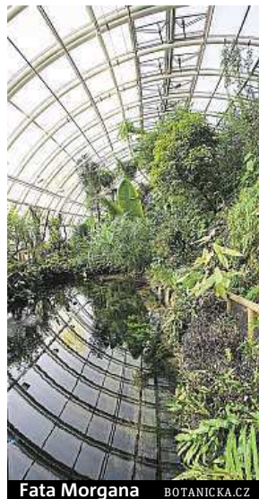
Fata Morgana BOTANICKA.CZ